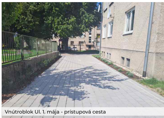
Vnútroblok Ul. 1. mája - prístupová cesta

Vnútroblok medzi ulicami 1. mája a Obrancov mieru prešiel taktiež výraznou premenou. Predovšetkým ide o vybudovanie spevnených plôch, zatravnovaných plôch, zakomponovanie vodného prvku v centrálnej časti vnútrobloku, umiestnenie oddychových prvkov ako napr. kruhová lavička obkolesujúca strom. Pre nádoby na komunálny odpad, zmesový aj triedený, bol vybudovaný prístrešok so zelenou strechou. Riešenia rovnako kladú dôraz na tvorbu a ochranu zelene.