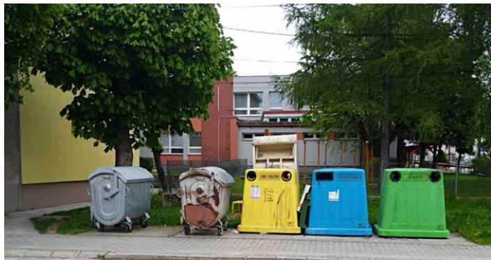
Vnútroblok Ul. 1. mája - pred...

Revitalizácie vnútroblokov v sebe skĺbili ekologický aspekt a zvýšenie kvalitatívnej a estetickej úrovne životného prostredia obyvateľov mesta Rajec.