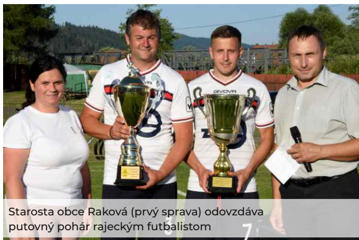
Starosta obce Raková (prvý sprava) odovzdáva putovný pohár rajeckým futbalistom