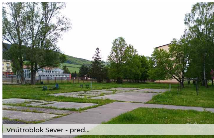
Vnútroblok Sever - pred...