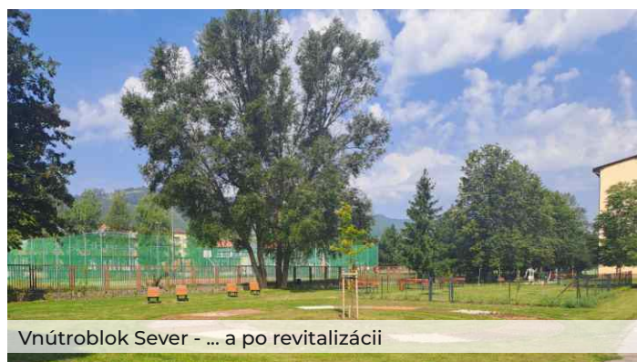
Vnútroblok Sever - ... a po revitalizácii

Vnútroblok medzi ulicami 1. mája a Obrancov mieru prešiel taktiež výraznou premenou. Predovšetkým ide o vybudovanie spevnených plôch, zatravnovaných plôch, zakomponovanie vodného prvku v centrálnej časti vnútrobloku, umiestnenie oddychových prvkov ako napr. kruhová lavička obkolesujúca strom. Pre nádoby na komunálny odpad, zmesový aj triedený, bol vybudovaný prístrešok so zelenou strechou. Riešenia rovnako kladú dôraz na tvorbu a ochranu zelene.