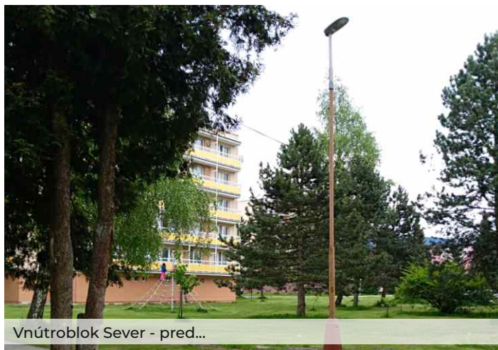
Vnútroblok Sever - pred...

Obnova vnútrobloku Sever bola realizovaná s dôrazom na uplatnenie ekologických princípov tvorby a ochrany zelene a zároveň boli použité také riešenia v oblasti oddychových a hracích zón, aby oslovili všetky vekové kategórie obyvateľov. Okrem významného rozšírenia a obnovy zelene môžu obyvatelia mesta využívať hracie prvky pre deti, zážitkový chodník, knižné búdky, lavičky, šachové stoly a pod. Rozšírená je aj sieť chodníkov pre peších v priestore vnútrobloku.