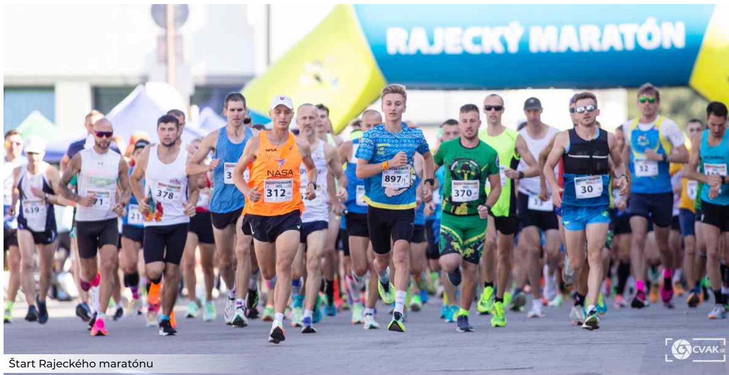
Štart Rajčského maratónu