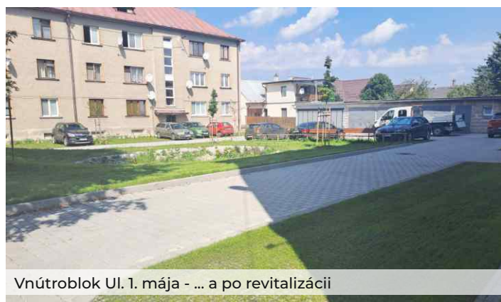
Vnútroblok Ul. 1. mája - ... a po revitalizácii