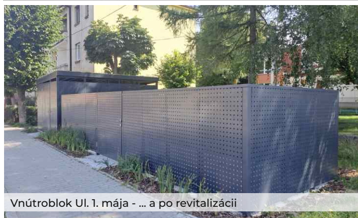
Vnútroblok Ul. 1. mája - ... a po revitalizácii