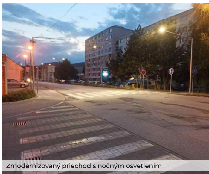
Zmodernizovaný priechod s nočným osvetlením

Miestna akčná skupina Rajecká dolina poskytla Mestu Rajec finančný príspevok na realizáciu projektu „Zabezpečenie pasívnej bezpečnosti na prietahu cesty I/64 v meste Rajec – Priechod pri križovatke ulíc Hollého a Štúrova“.