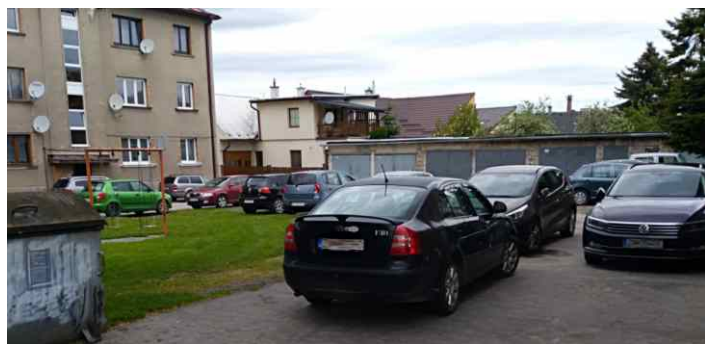
Vnútroblok Ul. 1. mája - pred...