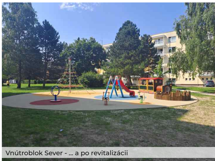
Vnútroblok Sever - ... a po revitalizácii