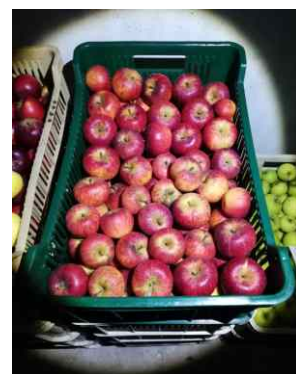
Bedničky na uskladnenie

ní vytvára ostrý hrot, ktorý sa ľahko zapichne do susedného jablka alebo hrušky. Plodom s krátkou stopkou pridržíme pri vylamovaní konárik druhou rukou. V oboch prípadoch vylamujeme smerom od púčika, pretože ostrý púčik ľahko prepichne šupku (napr. u odrody Topaz). Plody sa nesmú trhať ťahaním, krútením, prípadne striasť zo stromu. S odtrhnutými plodmi treba narábať ako s vajčkami, opatrne ukladať, prekladať, nepresypať!, aby sa predišlo poškodeniam šupky a otlačeninám. Aj mikroskopické narušenie šupky spôsobí skôr či neskôr predčasné znehodnotenie