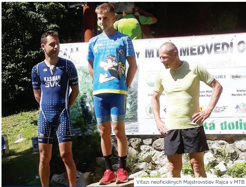
Vitazi neoficiálnych Majstrovstiev Rajca v MTB