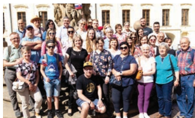
Praha – Hradčany

Za Zbor sv. Ladislava Martina Rybárová