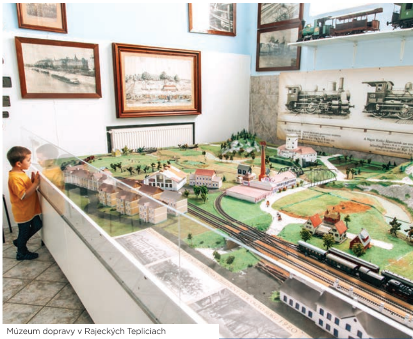
Múzeum dopravy v Rajeckých Tepliciach

Skalný budzogáň je jedinečný skalný útvar, ktorý má podobu zovretej päste a je vysoký približne 12 m. Tento fenomenálny prírodný úkaz je výsledkom erozívnej činnosti mrazu a vody. Dovedie vás k nemu napr. náučný chodník z Rajeckých Teplíc, ktorého tabule popisujú nielen prírodné prostredie okolia, ale i zaujímavú legendu. Tá hovorí, že v minulosti na mieste, kde dnes stojí budzogáň, rástol mohutný strom Hromodub. Jedného dňa okolo neho prechádzal obor a ten sa rozhodol, že si z neho vyrobí budzogáň. Keď si však od únavy zdiemol, miestni obyvatelia mu natreli nohy miazgou. Po tom, ako obor zistil, že sa nemôže hýbať, od hnevu z celej sily zapichol budzogáň do zeme, preklial ho, a tak sa z neho