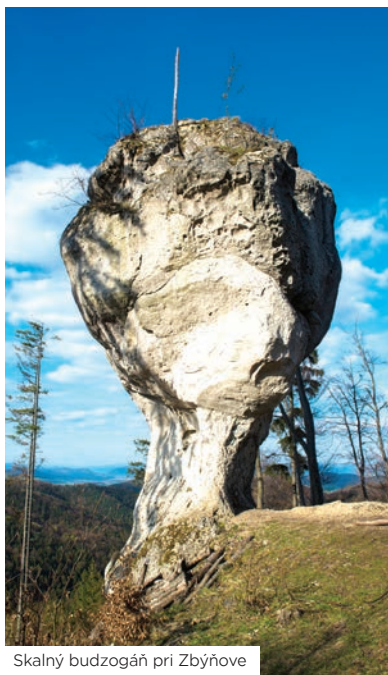
Skalný budzogáň pri Zbýňove