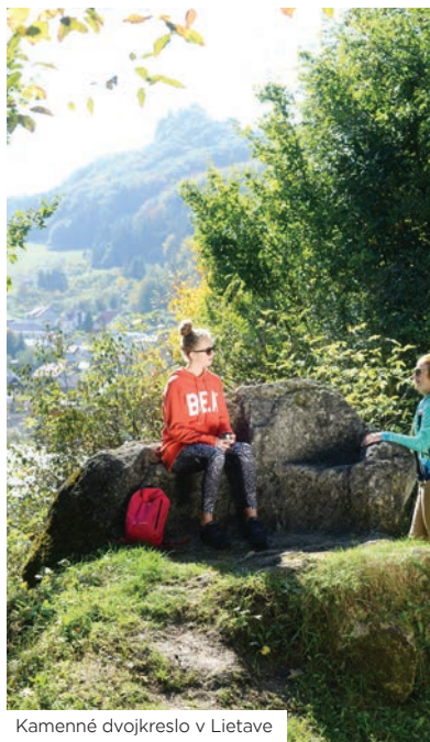
Kamenné dvojkréso v Lietave