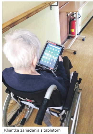
Klientka zariadenia s tabletom

a stávajú sa letargickými a upadajú do apatie.