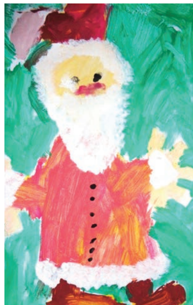
R. Musil, 5 r.

Martinovho bieleho koňa sme však do polovice decembra mohli pozorovať len v dialke, napr. na zasneženej Ďurčanke, Klaku či ešte vzdialenejších Martinských holiach.