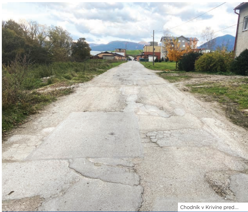
Chodník v Krivíne pred...

Čo sa väčších investičných akcií týka, v budúcom roku počítame najmä s pokračovaním rekonštrukcií chodníkov a dokončením športovej haly. Nečakal som, že pandémie až do takej miery ovplyvní tieto dve zásadné investície, že sa v roku 2020 ne-realizujú, no je to realita a pokračovať sa musí v roku 2021. Popri tom do marca musíme stihnúť vybudovať klientske centrum, pretože naň bola schválená