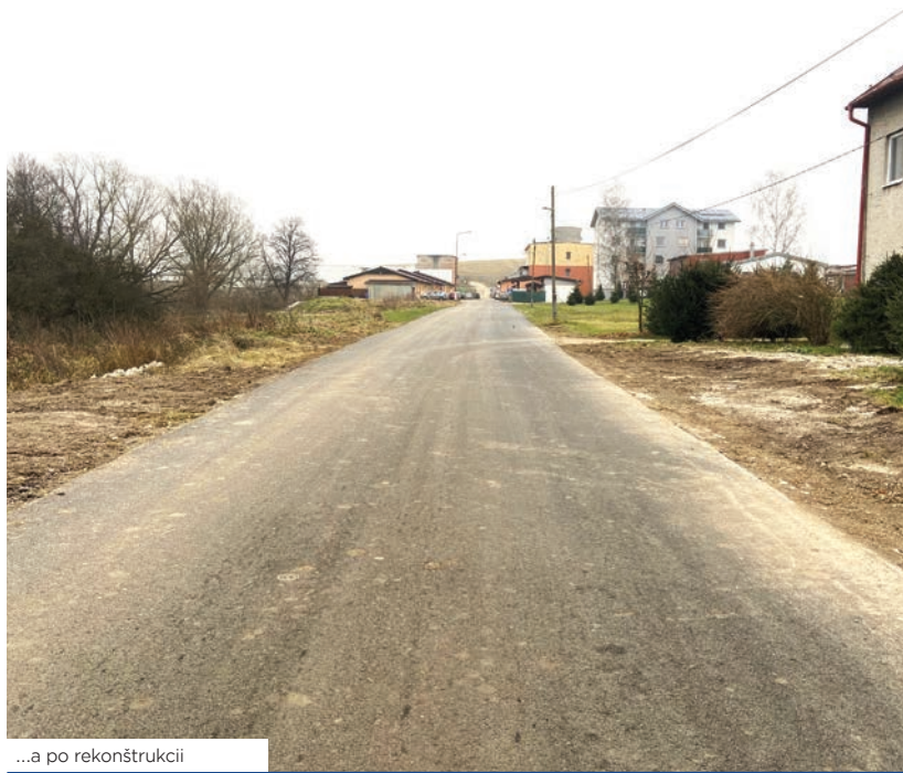
...a po rekonštrukcii

Ja vám želim, aby ste tohtoročné vianočné sviatky prežili v kruhu svojich najbližších najmä v zdraví a pokoji, aby ste tou správnou nohou, plní odhodlania a optimizmu mohli vykročiť do roku 2021.