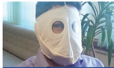
týchto ochranných rúšok. Rúško stačilo oprať a bolo k dispozícii na používanie. MsÚ Rajec

Aj keď rúška vyzerajú tak, ako vyzerajú, celotvárové rúška chránia okrem dýchacích ciest aj oči a uši a nakoľko sa koronavírus šíri aj prostredníctvom sliznice oka, niektorí z obyvateľov ocenili možnosť aj takto sa chrániť pred koronavírusom Covid-19. Pre zaujímavosť, už v prvý deň sa rozobralo okolo 300