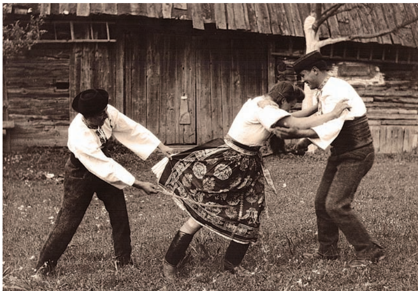
Veľkonočná šibačka v Ďurčinej.

Biela sobota sa nesie v znamení príprav obradných jedál