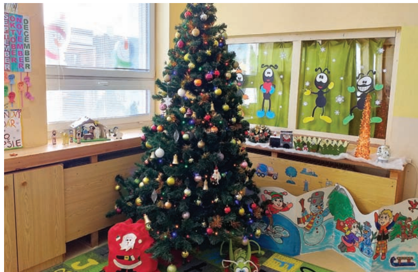
Víťazná fotografia s vianočnou výzdobou.