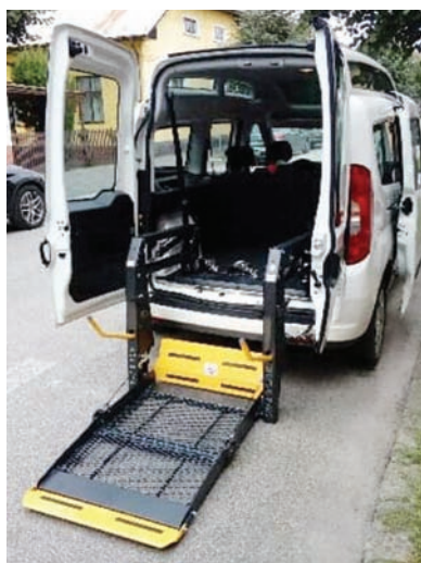
Sociálny taxík s plošinou na invalidný vozík.

Rok ubehol ako voda a je čas na bilancovanie. Ja tento rok hodnotím kladne, podstatné však je, ako ho hodnotia občania. Z môjho pohľadu – urobil sa kus roboty a základný cieľ na začiatok, aby občan ani minimálne negatívne nepocítil zmenu na primátorskom poste, sa splniť podarilo. Napriek tomu, bol to rok prvý, a to ako pre mňa, tak aj pre časť mestského zastupiteľstva, a preto si myslím, že ďalšie roky sa nám spoločne toho podarí spraviť ešte oveľa viac. Pre mňa je práve záver roka najviac hektické obdobie, detailnému hodnoteniu sa povenujem začiatkom roka. Keď sa však predsa len spätne obzriem, vidím zrekonštruované cesty na Partizánskej a Švermovej ulici, zrekonštruovaný chodník na Hollého ulici, nové chodníky na cintoríne, zrekonštruovanú telocvičňu na ZŠ Lipová, ale aj drobnosti ako novú zástavku na Moyzesovej, nové, ale aj rekonštruované zábradlia na lávkach či novinky ako fit park pre seniorov, bezplatná WIFI na námestí a vianočné trhy. Nedá mi