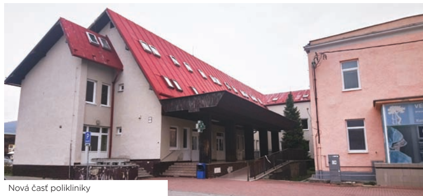
Nová časť polikliniky