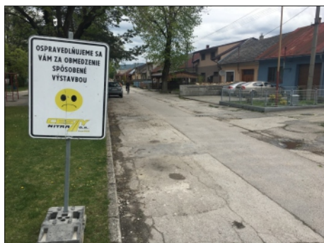
PRÁCE NA PARTIZÁNSKEJ ULICI

Rekonštrukcia oboch ulíc je tesne pred dokončením. Teda nový asfaltový koberec už je položený a zostáva vykonať niekoľko dokončovacích prác. Povrch na Partizánskej bol pred rekonštrukciou extrémne nerovný, preto po vyfrézovaní starého asfaltu a položení nového, vznikli výškové rozdiely pri vjazdoch do jednotlivých dvorov. Tu je potrebné doasfaltovať tieto vjazdy. Na tejto ulici bolo potrebné tiež zabezpečiť odvedenie dažďových vôd, v dôsledku čoho boli realizované výkopové práce v príľahom parku, ktorý je potrebné dať do pôvodného stavu. Celú rekonštrukciu komplikovalo nepriaznivé počasie, napriek tomu bola zrealizovaná vo veľmi dobrej kvalite. Verím, že budú obe cesty občanom slúžiť dlhé roky.