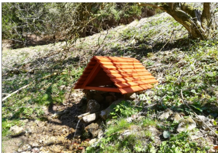
STUDNIČKA V PORUBSKEJ DOLINE

Dňa 26. marca 2019 sa konalo zasadnutie výboru Cenzuálu, ktorého sa zúčastnil aj člen DR. Nosným bodom rokovania bola príprava Valného zhromaždenia pozemkového spoločenstva. Ako sme už informovali v predchádzajúcom vydaní mesačníka Rajčan, VZ sa bude konať dňa 15. mája 2019 tradične v Kultúrnom dome Rajec o 15.00 hod. Prezentačná účasť sa začína 1,5 hod. pred začiatkom konania. Výbor prijal uznesenie k organizačnému zabezpečeniu VZ, schválil náležitosti pozvánky, ako aj jej príloh. Ako príloha pozvánky bude Správa o činnosti, vyhodnotenie plnenia plánu hospodárenia Cenzuálu za uplynulý rok vrátane opráv a investícií, návrh plánu hospodárenia pre rok 2019, vrátane plánovaných opráv a investícií. Súčasťou pozvánky bude aj nová Zmluva o spoločenstve a Stanovy pozemkového spoločenstva s komentárom a tiež tlačivo na prípadné splnomocnenie. Výbor verí v hojnú účasť členov pozemkového spoločenstva, pre ktorých pripravil občerstvenie – kotlíkový poľovnícky guláš. Výbor ďalej prerokoval rôzne aktuálne otázky týkajúce sa hospodárenia, najmä priebežné plnenie výroby, odbytu, realizácie opráv na majetku a ekonomické otázky. Po diskusii výbor prijal príslušné uznesenia.