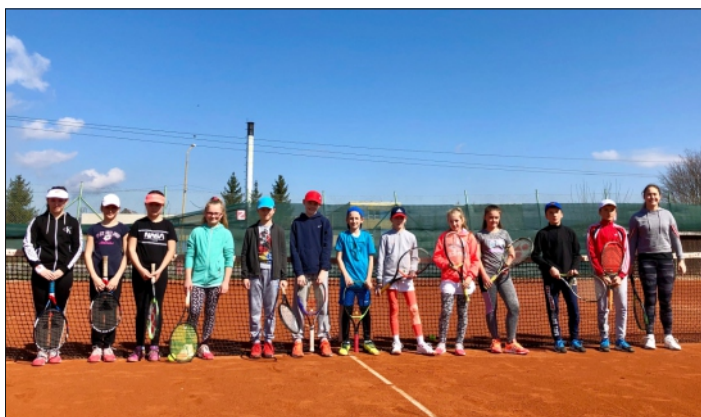
PRIATEĽSKÉ ZÁPASY S HRÁČMI Z INÝCH KLUBOV SA TEŠIA V RAJCI POPULARITE

Tenisový klub v Rajci písal minulý rok už svoju 30. ročnú históriu. Za toto obdobie sa striedali silnejšie aj slabšie obdobia, v niektorých sezónach to s členskou základňou a udržaní sa v súťažiach nevyzeralo príliš ružovo. Našťastie sa opäť v posledných rokoch zišla partia nadšencov, vďaka ktorým prichádzajú nové a nové deti, organizujú sa rôzne neformálne zápasové stretnutia, vzniká zdravá športová rivalita a dlhé hodiny tréningov môžeme zúročiť na individuálnych alebo kolektívnych turnajoch. Teší nás, že aktuálne evidujeme približne 30 členov klubu z Rajca a priľahlých obcí.