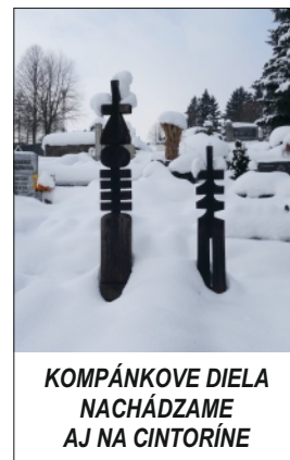
KOMPÁNKOVE DIELA NACHÁDZAME AJ NA CINTORÍNE

Eva Stanková, OZ Tilia