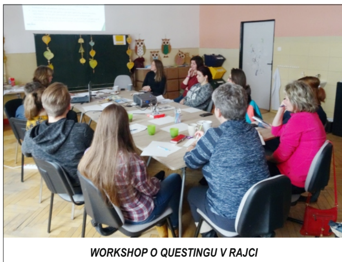
WORKSHOP O QUESTINGU V RAJCI

Po zverejnení pozvánky na workshop o questingu si mnohí slovo quest/questing museli zadať do vyhľadávača. Pre viacerých to však už nie je novinka. Trojdňové vzdelávacie stretnutie o tom, ako pátračky/questy sami tvoriť, sme pripravili v januári v OZ Tilia.