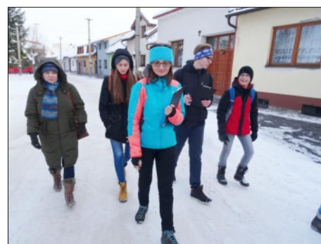
PRÁCA V TERÉNE: HĽADÁME MIESTA Z OBRAZOV V. KOMPÁNKA

Questing bol len pokračovaním vzdelávania o učení sa vonku a práci s deťmi v teréne. Už v novembri sme sa stretli so skupinou učiteľov a lektorom z pražskej organizácie Tereza, ktorá sa zameriava na bádateľské formy vyučovania, a okrem iného ponúka inšpirácie na učenie vonku aj systematické výučbové ekovýchovné programy, napr. Les v škole. Téma „deti vonku“ sa venujeme dlhodobo, časť aktivít, vrátane questingu, realizujeme v rámci projektu Deti v prírode – ohrozený druh, ktorý podporila Nadácia pre deti Slovenska v programe Hodina deťom. Ďakujeme!