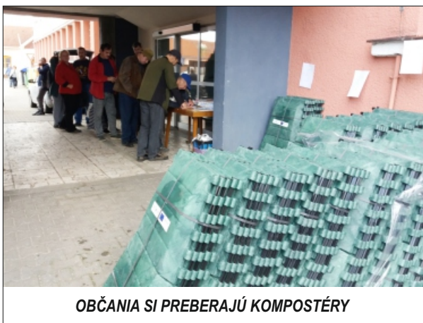
OBČANIA SI PREBERAJÚ KOMPOSTÉRY

Upozorňujem na to, že po rozdání kompostérov, od jari budúceho roku, už nebudú po Rajci stojiská na pokosenú trávu. Lebo sme svedkami toho, že máme na území mesta jedenásť smetísk, pretože niektorí ľudia nie sú ochotní dodržiavať a rešpektovať podmienky tejto služby, v ktorej sme obyvateľom vyhovelí. Niekedy máme dokonca pocit, že niektorí ľudia naschvál zneužívajú túto situáciu a ešte z toho majú radosť.