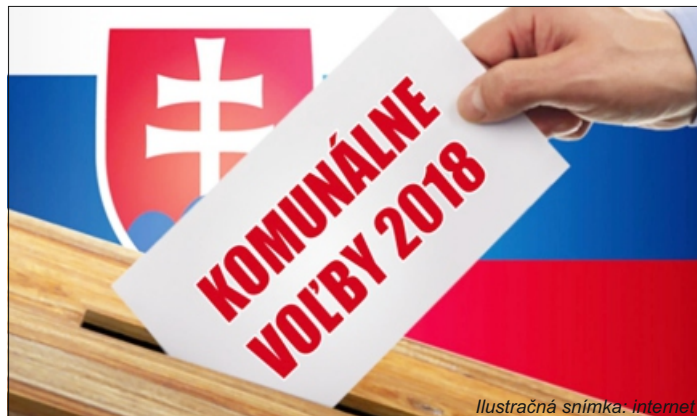
Ilustračná snímka.