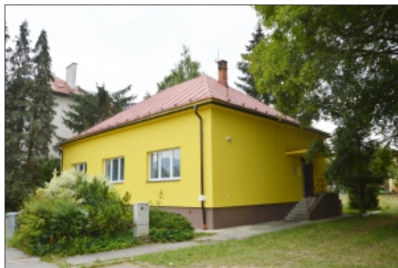
ZATEPLENÁ BUDOVA ŠPECIÁLNOPELAGOGICKÉHO CENTRA