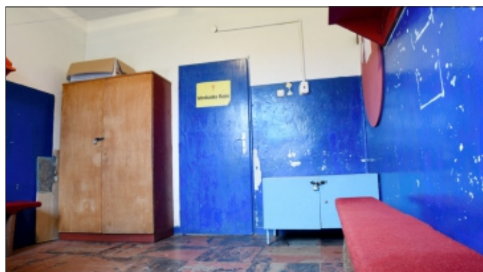
Snímky 1 a 2.: PŮVODNÝ STAV ZÁZEMIA FK RAJEC

Treba podotknúť, že predmetné priestory neslúžia len našim futbalistom (domácim aj hosťujúcim), ale využívajú ich aj iné športové kluby v Rajci. Teda realizácia nášho úspešného projektu prinesie osov v dlhodobom aspekte širokému spektru užívateľov.