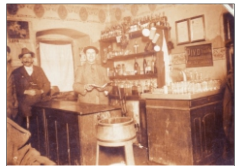
KRČMA V MESTSKOM PIVOVARĚ (DNES MESTSKÉ MÚZEUM)

V Rajci bolo rozšírené aj cechové varenie piva, ktoré pôvodne patrilo k starodávnym slobodám mešťanov. Právo variť pivo mali však len majitelia najmenej „štvrt' práta“ poľnohospodárskej pôdy, ktorí zároveň pestovali aj chmeľ. (jeden prút pôdy činil 5 uhorských jutár, jedno uhorské jutro činilo 4.315,9 m 2 ). Výrobu piva usmerňoval a riadil cech pivovarníkov. Mesto roku 1811 budovu pivovaru so značným nákladom opravilo, neskôr však ešte v 19. storočí (cechová aj mestská) výroba piva zanikla. V súčasnosti sa v budove nachádza mestské múzeum s dvoma expozíciami – národopis-