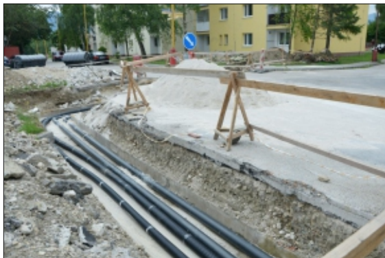
NOVÉ TEPLOVODY NA SÍDLISKU JUH

pred troma rokmi sa zrekonštruovala prvá časť rozvodov teplej vody a v tomto roku spoločnosť Bineko, v ktorej mesto vlastní nezamedbateľný podiel, zrekonštruuje druhú časť teplovodov z finančných prostriedkov získaných z eurofondov. Po ukončení prác bude mať sídlisko Juh na niekoľko desaťročí zabez-