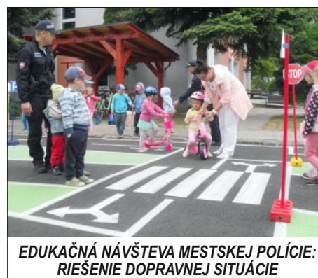
EDUKAČNÁ NÁVŠTEVA MESTSKEJ POLÍCIE: RIEŠENIE DOPRAVNEJ SITUÁCIE

Na edukačnú návštevu do materskej školy zavítala aj mestská polícia. Jej príslušníci zábavnou a poučnou formou poučili deti o základných zásadách správania sa v cestnej premávke a „bezpečne a hravo“ vyriešili vzorové dopravné situácie.