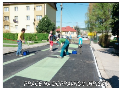
PRÁCE NA DOPRAVNOM IHRISKU

ochotným rodičom a priateľom školy a pani učiteľkám. Najväčšou odmenou pre všetkých zainteresovaných je radosť detí a nadšenie, s akým trávia čas na novom dopravnom ihrisku.