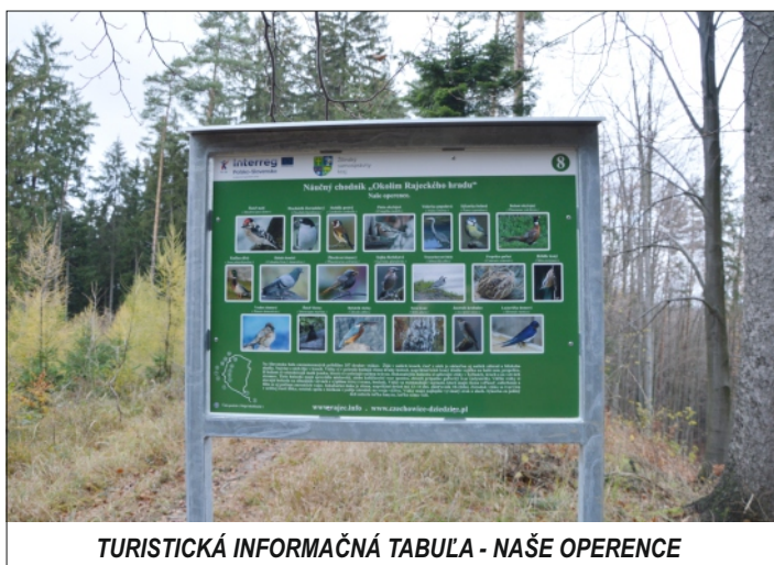
TURISTICKÁ INFORMAČNÁ TABUĽA - NAŠE OPERENICE

Náučný chodník sa realizoval v mesiacoch august a september 2017 a jeho informačné tabule sú umiestnené postupne od budovy Mestského múzea v Rajci, pri vstupe do termálneho kúpaliska Veronika a ďalej umiestnenie tabúľ pokračuje naprieč horským masívom Dubo-