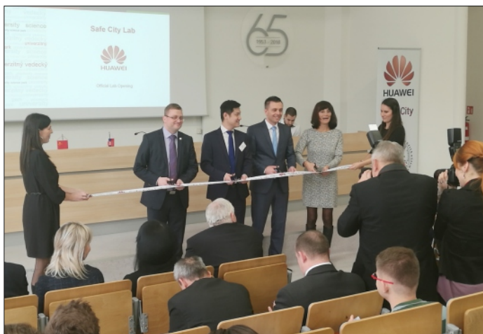
SLÁVNOSTNÉ PRESTRIHÁVANIE PÁSKY (SPRAVA) REKTORKOU ŽU, ZÁSTUPCOM MINISTERSTVA ŠKOLSTVA, VEDY, VÝSKUMU A ŠPORTU, ZÁSTUPCOM FIRMY HUAWEI A RIADITEĽOM VÝSKUMNÉHO PARKU