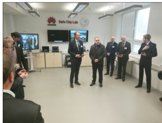
PREDNOSTA MSÚ RAJEC SPOLU S DEKANOM FAKULTY INFORMUJE O SÚČASNÝCH POZNATKOKH Z REALIZÁCIE PROJEKTU

mier, komunikácie medzi účastníkmi a z kamier jednotlivých účastníckych zariadení. Ústredňa je prenosná a umožňuje spojznenie za približne 15 minút. Akčný rádius je 6 až 10 km. Jednotlivé ústredne dokážu vytvárať tzv. bunkovú sieť. Ústredňa i všetky účastnícke zariadenia majú krytie IP 67. Využitie je vhodné