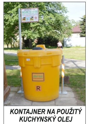
KONTAJNER NA POUŽITÝ KUCHYNSKÝ OLEJ

Sme radi, že aj takýmto spôsobom prispeje meďalšou troškou k zníženiu znečistenia životného prostredia, lebo použitý kuchynský olej už nebude končiť v kanalizácii, ktorú zanáša, nebude slúžiť ako potrava pre hľadavcov a v neposlednom rade nebude znečisťovať naše okolie.