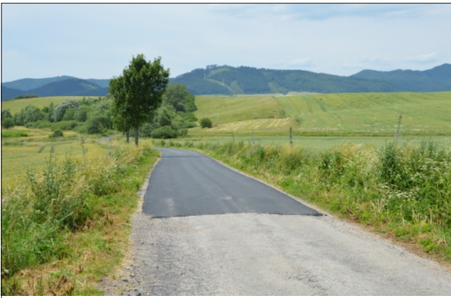
OBNOVENÝ ÚSEK CESTY SMEROM DO PORUBSKEJ DOLINY

V budúcom roku budeme pokračovať a v priebehu štyroch-piatich rokov by sme chceli v spolupráci s cenzuálom obnoviť cestu až po Strelnicu v Kamennej Porube.