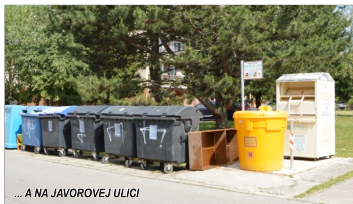
... A NA JAVOROVEJ ULICI

Odporúča sa olej po vychladnutí zliať cez sitko do suchej a čistej PET fľaše. Sklenené obaly nie sú vhodné, pretože sa môžu pri prevoze rozbiť. Na zber je možné použiť všetky klasické PET fľaše, ktoré po odovzdaní budú následne separované a ekologicky recyklované.