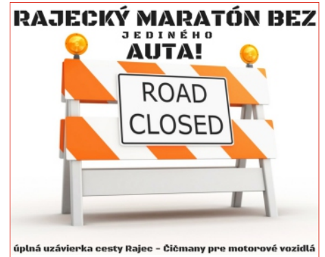
Úplná uzávierka cesty Rajec - Čičmany pre motorové vozidlá