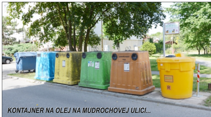
KONTAJNER NA OLEJ NA MUDROCHOVEJ ULICI...

Olejový odpad má nepriaznivý dopad aj na čistiarne odpadových vôd, kde vytvára nepriepustné vrstvy, ktoré znižujú čistiacu schopnosť mikroorganizmov v aktivačných nádržiach. Hrozí až ich úplné odumretie a znečistená voda sa tak môže dostať do vodných tokov. Použitý olej obsahuje karcinogény, ktoré môžu spôsobiť rakovinu. A v neposlednom rade každá kvapka oleja znečisťuje podzemnú a povrchovú vodu.