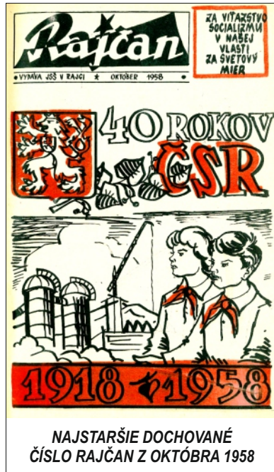
NAJSTARŠIE DOCHOVANÉ ČÍSLO RAJČAN Z OKTÓBRA 1958

Prvé číslo časopisu Rajčan vyšlo v októbri v roku 1957. Redakcia vtedy sídlila v bývalej Jedenástročnej škole v Rajci a vydával ho vtedajší Osvetový dom. Časopis Rajčan vždy vydávali a tvorili dobrovoľníci, ktorí si popri svojom zamestnaní museli nájsť čas na zostavenie každého nového čísla, preto Rajčan nevychádzal každý mesiac. Boli obdobia, keď vyšli aj dve čísla do mesiaca, ale boli aj obdobia, keď vyšlo číslo raz za 2 až 3 mesiace. Rozdiely boli aj v rozsahu strán – niektoré čísla mali iba štyri, šesť či osem strán. Postupne sa rozsah strán v jednom čísle ustálil na čísle dvanásť, iba letné dvojčíslo júl-august má šesťnásť strán. V súčasnosti vychádza jedenásť čísel do roka a stali sme sa mesačníkom.