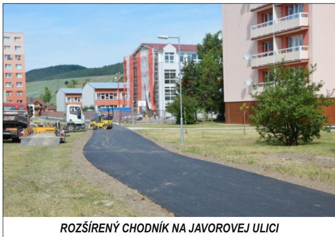
ROZŠÍRENÝ CHODNÍK NA JAVOROVEJ ULICI

Predpokladáme, že sa v našom meste spoločné tábory ujmú a v budúcnosti budeme môcť s nimi pokračovať. Aby sme mohli vychádzať v ústrety nielen rodičom detí v materských školách, ale počas letných prázdnin aj rodičom detí v základných školách.