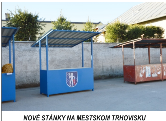
NOVÉ STÁNKY NA MESTSKOM TRHOVISKU

Začiatkom marca vyšla aj ďalšia výzva na ministerstve životného prostredia, kde pripravujeme žiadosť o pridelenie finančných prostriedkov na zateplenie obvodového plášt'a a výmenu strechy v Materskej škole na Mudrochovej ulici a v dome vedľa Katolíckej spojenej školy, kde toho času sídli špeciálno-pedagogické centrum.