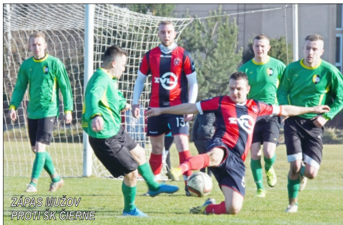
ZÁPAS MUŽOV PROTI ŠK ČIERNE