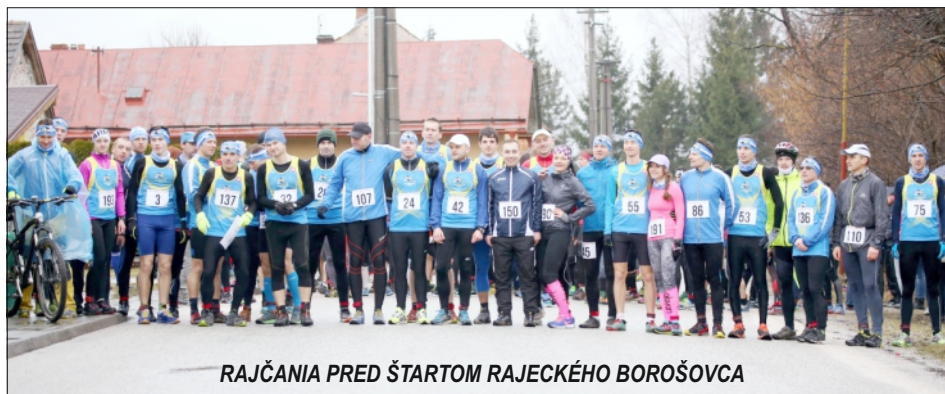
RAJČANIA PRED ŠTARTOM RAJECKÉHO BOROŠOVCA

Prvé podujatie z našej dielne teda máme úspešne za sebou a hneď sa vrhneme na ďalšie. 1. mája vás srdečne pozývame na Rajecký Kros duatlon . K bežeckým topánkam si treba prichystať aj horský bicykel, pretože nás čaká 6,6 km beh, 15 km na bicykli v kopcoch