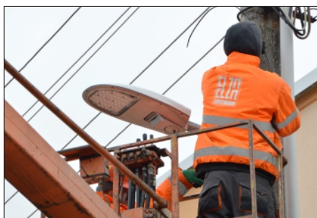
NOVÉ ÚSPORNÉ SVIETIDLÁ VEREJNÉHO OSVETLENIA

Nové verejné osvetlenie bolo kompletne spustené až v marci 2016, preto nemôžeme porovnávať celý rok 2015 s celým rokom 2016. Ale aj napriek tejto skutočnosti a napriek tomu, že sme navýšili počet svetelných bodov v meste, oproti roku 2015 sme usporili takmer 100 tisíc kWh energie (zhruba za 10 mesiacov), čo v peňažnej čiastke predstavuje úsporu asi 16 tisíc eur.