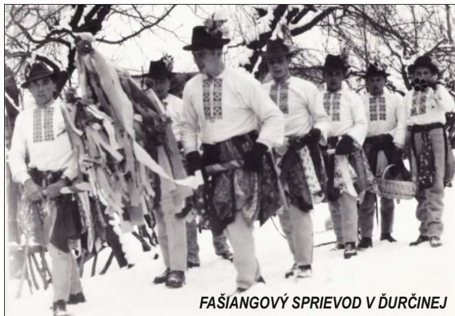
FAŠIANGOVÝ SPRIEVOD V ĎURČINEJ

V decembrovom čísle Rajčana sme vám predstavili rajecké zvyky v predvianočnom a vianočnom období. V tomto čísle budeme pokračovať tradíciami a zvykmi počas fašiangov, Veľkej noci, narodenia, smrti či sobáša. Prevažná časť textu je v rajeckom nárečí.