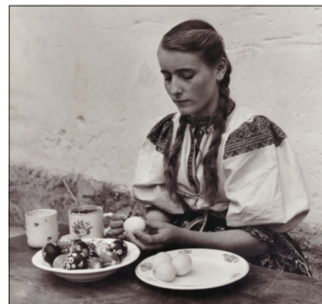
MALOVANIE VAJČOK VO FAČKOVE A ŠIBAČKA V ĎURČINEJ

Zdroj: Miloslav Smatana, Spravodaj mestského múzea Rajec 1/1995, s. 8-9 (krátené) Spracovala Z. Ščasná, MsÚ Rajec, odd. kultúry