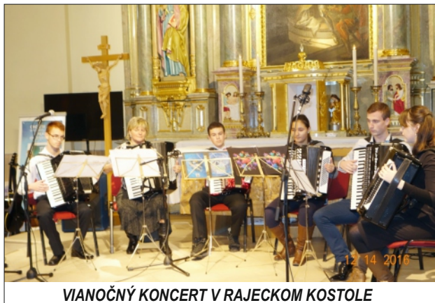
VIANOČNÝ KONCERT V RAJECKOM KOSTOLE