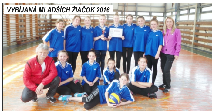
VYBÍJANÁ MLADŠÍCH ŽIAČOK 2016

Športový deň dievčat (8.12.2015): zúčastnili sa ho žiačky 5. až 9. ročníka. Dievčatá 5. a 6. ročníka súťažili vo vybíjaní a žiačky 7. a 8. ročníka v basketbale. Milé podujatie plné bojovnosti a radosti, pravá športová atmosféra, fair-play, to bol 5 hodinový športový deň dievčat.