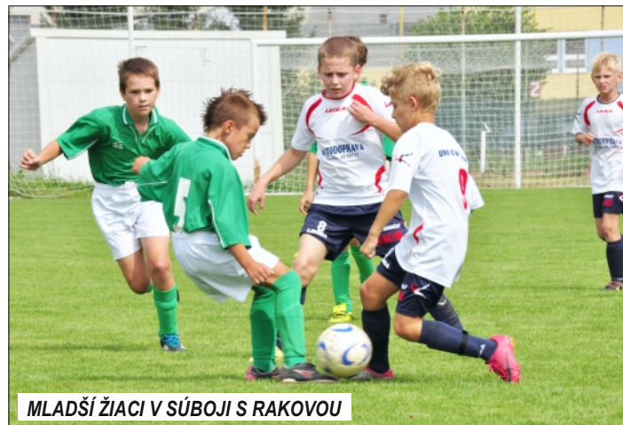
MLADŠÍ ŽIACI V SÚBOJI S RAKOVOU