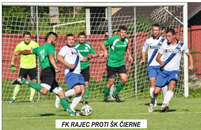
FK RAJEC PROTI ŠK ČIERNE