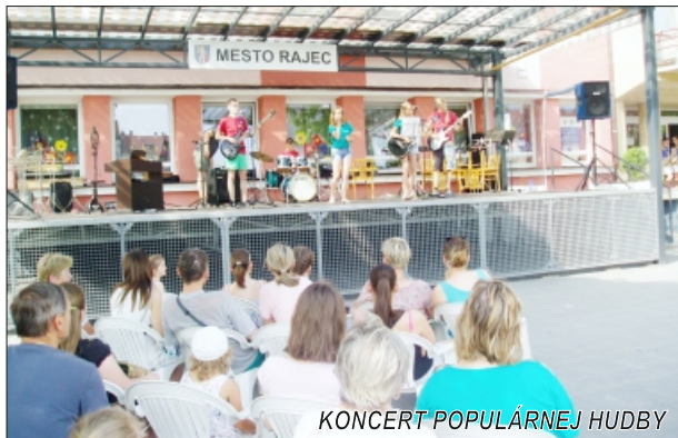
KONCERT POPULÁRNEJ HUDBY

Jedným z prvých letných podujatí na námestí je už tradičný Koncert populárnej hudby , ktorý sa uskutočnil v piatok 24. júna a neodmysliteľne patrí k Rajeckým hodom. Vystúpili na ňom žiaci a pedagógovia Základnej umeleckej školy v Rajci. Na úžasné výkony všetkých účinkujúcich môže byť vedenie rajeckej ZUŠ-ky právom hrdé.