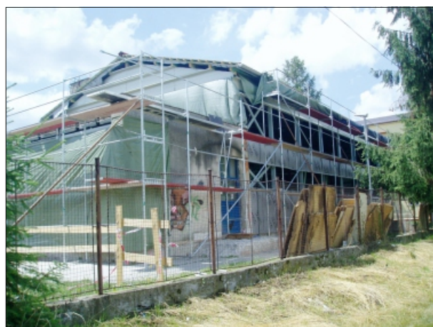
REKONŠTRUKCIA VEĽKEJ TELOCVIČNE

V ďalšej etape, na budúci rok alebo o dva roky, by sme chceli zrekonštruovať aj malú telocvičňu a zatepiť kotelňu pri škole.