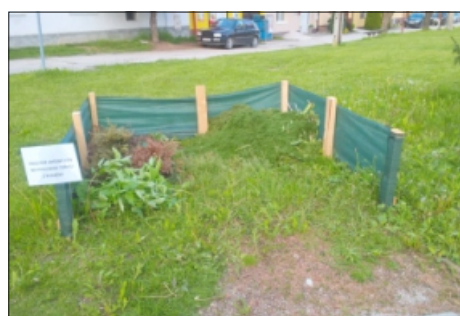
STANOVIŠTE NA NÁDRAŽNEJ ULICI

Na zasadnutí mestského zastupiteľstva sme vyhodnocovali aj efektivnosť a finančnú náročnosť stanovišť na pokosenú trávu. Už v minulom čísle som upozorňoval občanov čo