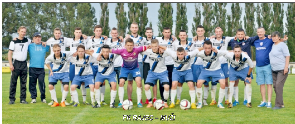
FK RAJEC – MUŽI