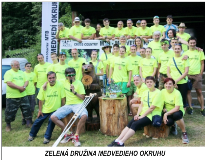
ZELENÁ DRUŽINA MEDVEDIEHO OKRUHU

Na záver tu máme pozvánku. Naše krásne mesto bude mať aj tento rok dvojce Vianoce. Tými kalendárne prvými je akcia, ktorú máme všetci tak veľmi radi – Rajecký maratón . Čo najsrdečnejšie vás pozývame na tento