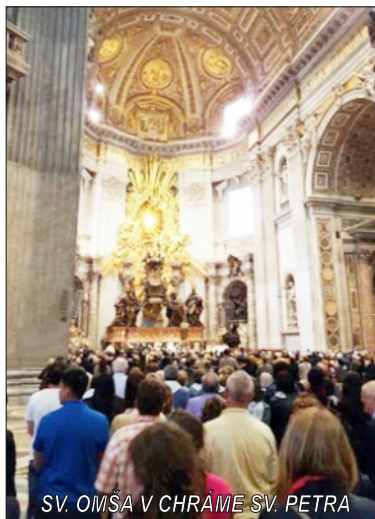
SV. OMŠA V CHRÁME SV. PETRA

Tu sa skončilo naše dobrodružstvo. V stredu ráno 6.30 sme už parkovali pri rajeckom kostole. Vrátili sme sa plní emócií, nadšenia, elánu a sil do ďalších rokov. Zo zážitkov z tejto púte budeme čerpať ešte dlhý čas. A že sme v Ríme zanechali dobrý dojem, o tom svedčia aj desiatky ďakovných e-mailov, ktoré prichádzajú od hostí koncertu na adresu SKM i Slovenského inštitútu v Ríme. Ďakovný e-mail od veľvyslanca SR v Taliansku a od p. Dvorského prišiel aj primátovi mesta Rajec.