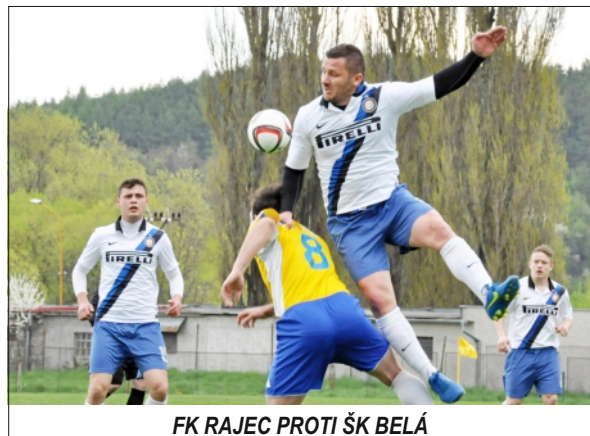
FK RAJEC PROTI ŠK BELÁ

V prvom jarnom zápase na domácej pôde Rajec privítal súpera z Belej. Na domácom ihrisku mu chcel oplatiť prehru 4:1 z jesennej časti. Tento plán začal Rajec naplňať už od úvodu, keď sa prezentoval aktívnou ofenzív-