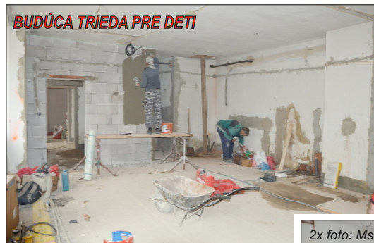
BUDÚCA TRIEDA PRE DETI

Áno, s rekonštrukciou hospodárskeho pavilónu a stavebnými prácami v materskej škole sa už začalo. Ak pôjde všetko podľa plánu, tak už koncom júna budú práce ukončené. Po ukončení prác budeme môcť v septembri 2016