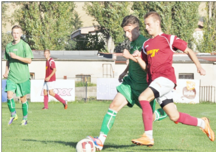
Výsledky prípravných zápasov A-mužstva

Hráči A-mužstva FK Rajec odohrali v rámci prípravy na jarnú časť sezóny niekoľko prípravných zápasov, so súpermi z rôznych súťaží, v ktorých sa im darilo striedavo.