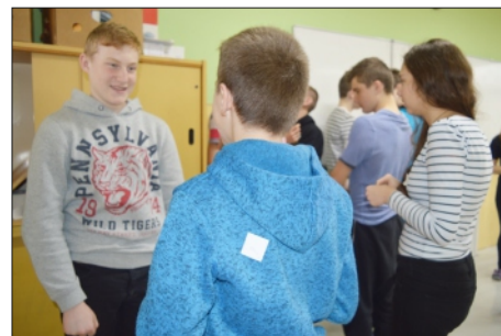
AKTIVITA: STICKY LABELS – NÁLEPKY (TRIEDA IX.C)

Ako môžete vidieť, metóda CLIL spojená s rôznymi metodickými aktivitami, je pre našich žiakov realizovaná pútavou a zároveň zábavnou formou, ktorá zaujme žiakov bez ohľadu na vek. V rámci projektu je táto metóda nápomocná pri tvorbe materiálov o našom regió-