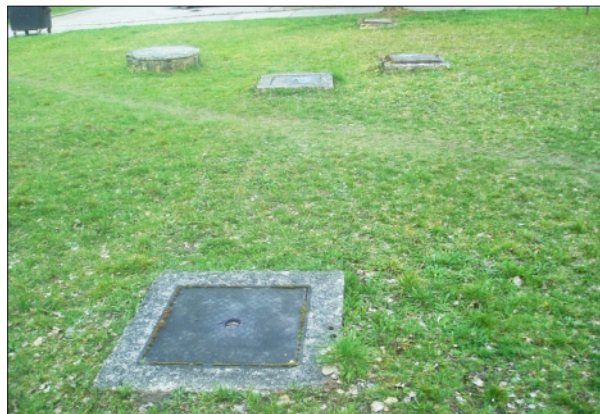
STARÉ ŠACHTY NA JABLOŇOVEJ ULICI

V minulosti sme v spolupráci so Severoslovenskými vodárňami a kanalizáciami Žilina všetky tieto šachty a žumpy prepojili s kanalizáciou a stali sa nepotrebné.