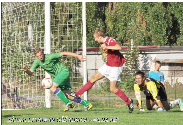
ZÁPAS: TJ TATRAN OŠČADNICA – FK RAJEC

Zápas sa hral na ťažkom teréne, kde sa mužstvám nedarilo kombinovať. V úvode diváci sledovali bojovný, vyrovnaný futbal. Domáci sa dostali do vedenia v 15. minúte, keď po faule na brankára Fraštiu ostala