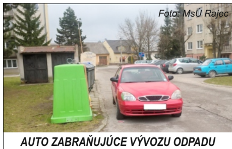
AUTO ZABRAŇUJÚCE VÝVOZU ODPADU

Táto veta v poslednej dobe často zaznieva v telefóne Mestskej polície Rajec. Vo väčšine telefonických hovorov sa občania domáhajú odpovede, nakoľko reagujú na upozornenie, ktoré si našli za stieračom svojho motorového vozidla. Pokiaľ ste si takéto upozornenie našli aj vy, tak je to preto, že ste porušili niektoré z ustanovení zákona č. 8/2009 Z. z. o cestnej premávke. V čom je hlavná podstata problému?