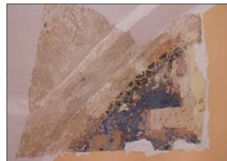
NÁJDENÁ VÝZDOBA IZIEB

súdržná s podkladom. Do hmoty štukového profilu je pridaný preosiaty, jemný, riečny piesok. Pravdepodobne z dôvodu ľahšieho spracovania hmoty. Základným náterom je hladký, svetlo maslový, vápenný náter. V tejto bielej farebnej úprave fungoval priestor pomerne dlhý čas, pretože množstvo na seba nanesených bielych náterov je odhadované v množstve 12 až 15. Po tejto hrubej vrstve bielych, vápenných náterov pokračuje farebné riešenie miestností vo svetlomodrej farbe, ktorá sa v jednotlivých vrstvách farebne mení od modro-šedej, po modro-šedú teplú až do zelenkava. Tieto bledomodré nátery súvisia zrejme aj s úpravou čelnej fasády použitím kobaltové-