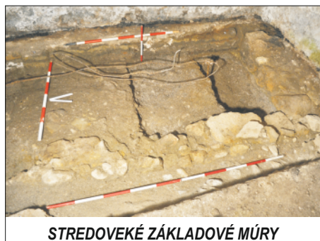
STREDOVEKÉ ZÁKLADOVÉ MÚRY

zástavby múzea. Pravdepodobne sú pozostatkom stavebnej aktivity pred výstavby renesančného štvorcového námestia.