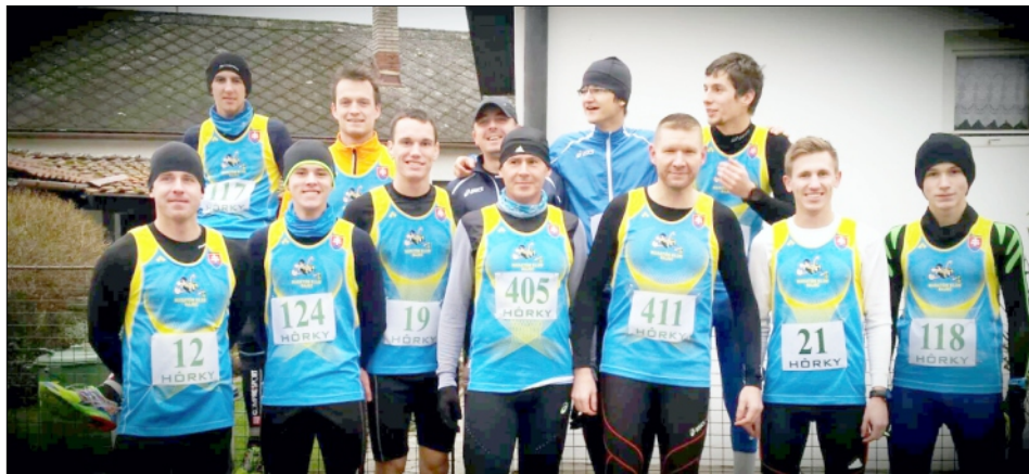
TRADIČNÝ NÁSTUP RAJČANOV PRED ŠTARTOM NA HÔRECKEJ ŠESTKE

Ako som už v úvode napísal, ani sme sa nenazdali... a je tu nový rok. V mene celého Maratón klubu Rajec sa vám chceme poďakovať, milí Rajčania, za priazeň, ktorú nám prejavujete. Ste vždy tí najlepší fanúšikovia a aj vďaka vám sa tento rok dožije Rajecký maratón už svojho 33. ročníka a polmaratón oslavi svoju prvú desiatku. Aj vďaka vám sa k nám rok čo rok vracia obrovské množstvo pretekárov s presvedčením, že naše podujatie je to