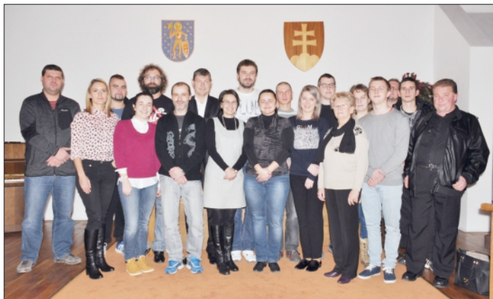
OCENENÍ DARCOVIA KRVI