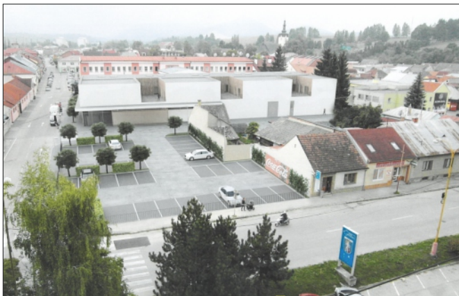
POLYFUNKČNÝ DOM S PARKOVISKOM NA ŠTÚROVEJ ULICI S PÔDORYSOM JEDNOTLIVÝCH BYTOV

K dnešnému dňu stále nevieme, ktorý obchodný reťazec vybuduje v budove na prízemí svoju prevádzku. Stále na tomto projekte spolu s investorom pokračujeme.