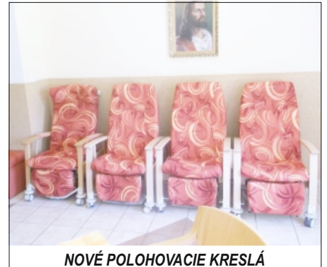
NOVÉ POLOHOVACIE KRESLÁ

V roku 2015 zariadeniu veľmi významne pomohla aj spoločnosť SIKO KÚPEĽNE, a.s. , ktorá poskytla Domovu vďaky možnosť nakúpiť materiál na plánovanú rekonštrukciu práčovne a kúpeľne s veľmi výraznou zľavou.