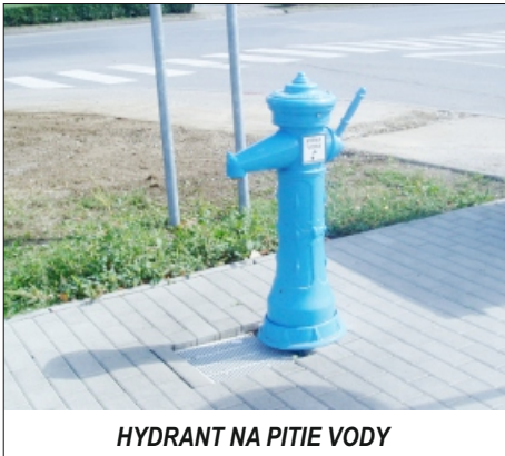
HYDRANT NA PITIE VODY

Minulý rok sme na sídlisku Sever dali vybudovať hydrant na pitie vody. V ostatnom čase sa tam však ľudia nechodia iba napiť, ale zvykli si tam niektorí občania chodiť s kánistrami a čerpajú si vodu do zásoby.