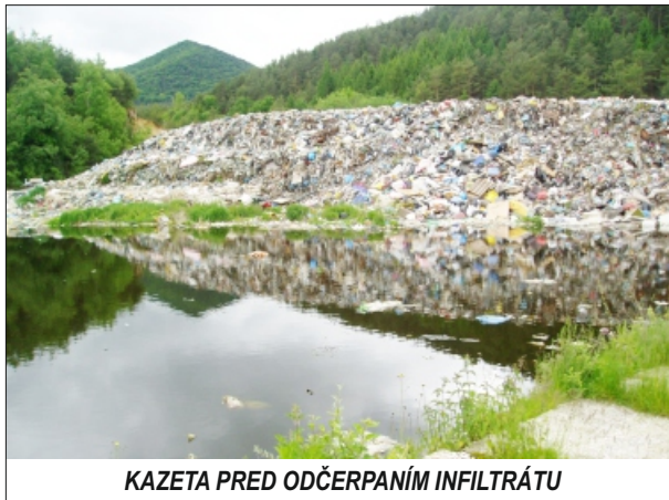
KAZETA PRED ODČERPANÍM INFILTRÁTU

Približne pred dvoma rokmi sme zistili, že prvá kazeta bude čoskoro plná a budeme musieť začať ukladať už aj do druhej, ešte voľnej kazety. Prázdna kazeta však bola zhruba do výšky 5 až 6 metrov zaplnená tzv. infiltrátom (zrážková voda). Pretože nebolo možné tento infiltrát inak odstrániť ako vybudovaním kanalizácie, pristúpili sme k prepojeniu a vybudovaniu kanalizácie zo skládky po rajeckú verejnú kanalizáciu. Toto sa nám podarilo minulý rok zrealizovať.