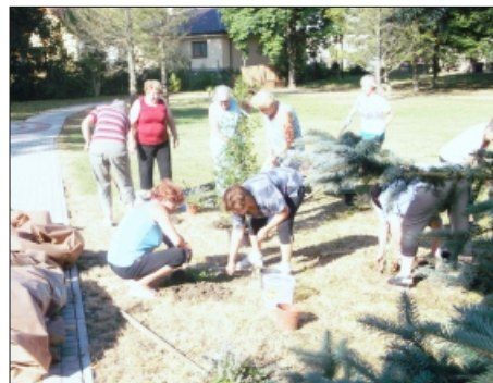
PARK PRI DOMOVE VĎAKY

Pri výsadbe nových rastlín spoločne s našimi seniormi pomáhali aj seniorky z Klubu dôchodcov – denné centrum Rajec a Jednoty dôchodcov Rajec .