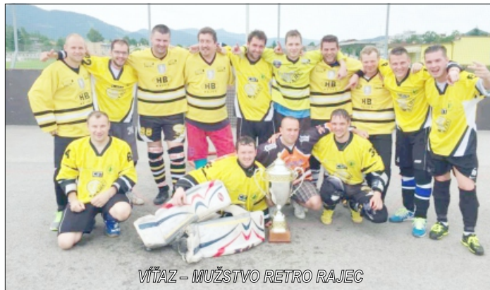
VÍTAZ - MUŽSTVO RETRO RAJEC