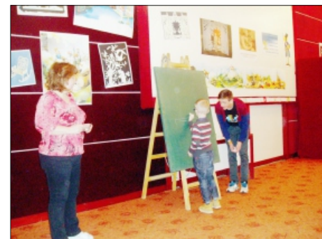
MEDZINÁRODNÝ DEŇ DETSKEJ KNIHY VENOVANÝ H. CH. ANDERSENOVI

V roku 2014 mestská knižnica uskutočnila 58 podujatí, na ktorých sa zúčastnilo 3 980 účastníkov.