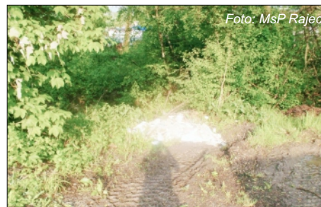
STAVEBNÝ ODPAD PRI ČISTIČKE

S odstupom času je možné povedať, že tento spôsob odberu sa osvedčil, čím výrazne prispel k zníženiu čiernych skládok v okolí mesta a jeho čistote. Existuje však opäť časť