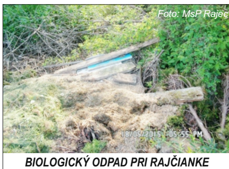
BIOLOGICKÝ ODPAD PRI RAJČIANKE

Realita je však taká, že 19. mája bolo z celkového počtu kontajnerov naplnených nielen odpadom, ale aj trávou až 79 z nich! Medzi takéto ulice patrili: Hollého, Športová, Nádražná, Bystrická, Kostolná, Švermova, Partizánska, Haškova, Mudrochova, Pri Rajčianke, Kollárová, Sládkovičova, Kmeťova, Šafárikova, Fučíkova, Obrancov mieru, Sama Chalúpku, Janka Kráľa, Benkova, Jilemnického, Frivaldského, Moysesova, 1. mája, Jánošíkova. Uvedené ulice sú spravidla zastavané rodinnými domami, čo pri prepočte na takéto domácnosti predstavuje podiel viac ako 87 %. V súčasnosti je to, bohužiaľ, pre občana najjednoduchší a najpohodlnejší spôsob zbavenia sa trávy – vyhodnením do smetných nádob. Túto skutočnosť podporuje fakt, že do kompostoviska chodí priemerne vyvážať biologický odpad za týždeň 8,2 domácností, čo je necelá 1 % z počtu rodinných domov. Medzi tie ulice, ktoré vyvážajú trávu, konáre a rôzny ďalší biologický odpad patria podľa počtu vývozov: 12x Moysesova, 8x Sama Chalúpku, 7x Janka Kráľa, 7x 1. mája, 4x: Kollárová, Benkova, Partizánska, Hollého, 2x: Záhradnícka, Kmeťova, 1x: Obrancov mieru, Kostolná, Švermova. Objem takéhoto odpadu je v priemere za jeden týždeň približne 635 kg. Ostávajúca časť 12 % biologického odpadu je zužitkovaná občanmi kompo-