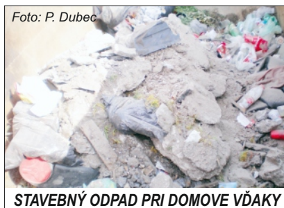
STAVEBNÝ ODPAD PRI DOMOVE VĎAKY

občanov, ktorí takto vytvorené podmienky neakceptujú. Potvrďuje to aj nedávno zistená čierna skládka stavebného odpadu vedľa prístupovej cesty do Čističky odpadových vôd. Doposiaľ nezistený páchatel takýmto spôsobom znečistil túto lokalitu stavebným odpadom, pričom stačilo tak málo na to, aby tento odpad skončil v zbernom dvore. Podobne sa zachoval ďalší občan, ktorý vysypal stavebný odpad do kontajnera pri Domove vďaky. Samotný kontajner nebolo možné v deň vývozu vysypať. Bolo nutné privolať nakladač, s ktorým sa síce podarilo kontajner vysypať, avšak kvôli preťaženiu došlo k poškodeniu jeho skeletu. Takéto chovanie azda nepotrebuje ďalší komentár!