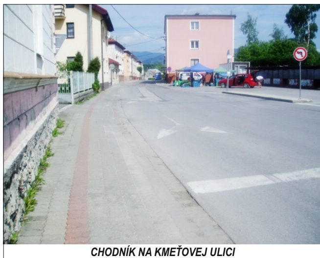
CHODNÍK NA KMEŤOVEJ ULICI