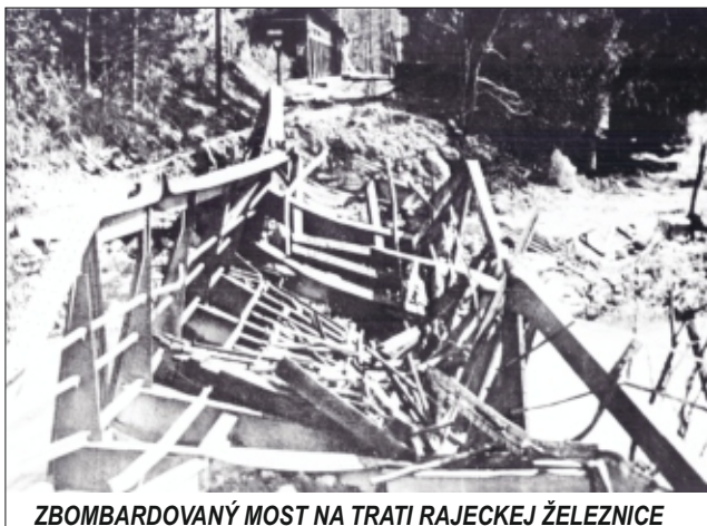
ZBOMBARDOVANÝ MOST NA TRATI RAJECKEJ ŽELEZNICE