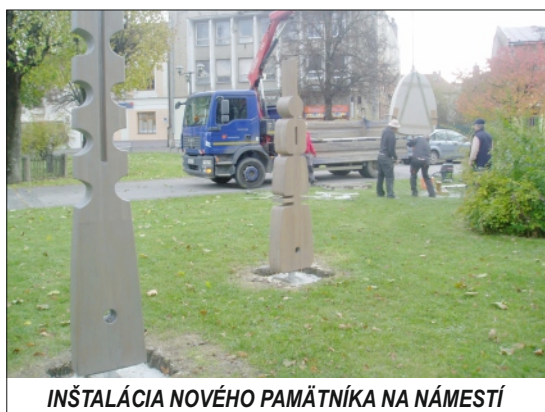
INŠTALÁCIA NOVÉHO PAMÄTNÍKA NA NÁMESTÍ

Iniciátormi vytvorenia tohto súsošia boli nielen ľudia z Rajca, ale i zo Žiliny či z Považia, ľudia, s ktorými Vladimír Kompánek spolupracoval alebo sa s nimi poznal a títo umelci prišli s návrhom zriadiť majstrovi Kompánkovi pamätník. S touto myšlienkou prišli zhruba pred rokom a Mesto Rajec sa touto požiadavkou začalo zaoberať. Poslanci mestského zastupiteľstva rozhodli, že aj Mesto Rajec prispeje finančnými prostriedkami na zriadenie pamätníka so súsoším.