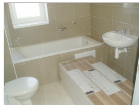
KÚPEĽŇA S WC V NOVÝCH NÁJOMNÝCH BYTOCH

Čo sa týka žiadostí zatiaľ to vyzerá tak, že na 99 % budú všetky byty obsadené ľuďmi, ktorí majú trvalý pobyt v Rajci.