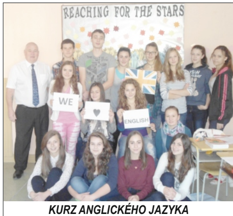
KURZ ANGLICKÉHO JAZYKA

sa nám podarilo zorganizovať dva úspešné kurzy. Jeden pre ôsmakov a druhý pre deviatakov. V kurze bolo cca 16 žiakov. Žiaci počas jedného týždňa absolvovali 30 hodín angličtiny (6 h/deň). Ako niektorí z nich poznamenali, prvé dni boli ťažké, ale to je normálne. Väčšina z nich mala blok rozprávať, ale postupne sa to zlepšovalo. Kurz bol zameraný predovšetkým na komunikáciu, na ktorú nám počas bežného vyučovania až tak veľa času nezostáva. Výborné bolo najmä to, že mali možnosť hovoriť s rodeným Angličanom, ktorý vie po slovensky len veľmi málo a zároveň je tiež učiteľom.