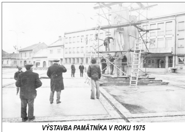
VÝSTAVBA PAMÄTNÍKA V ROKU 1975