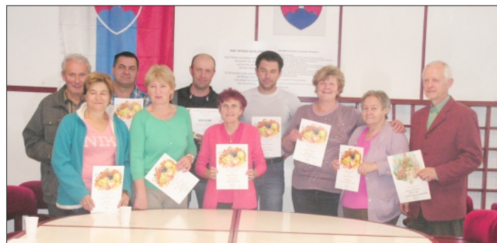
VÍŤAZNÍ ZÁHRADKÁRI A ICH VÝPESTKY