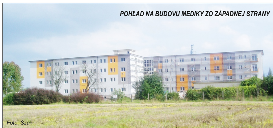
POHLAD NA BUDOVU MEDIKY ZO ZÁPADNEJ STRANY

Druhá investícia, ktorej investorom je mesto, sú práce na všetkých pripojeniach –