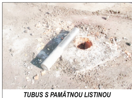
TUBUS S PAMÄTNOU LISTINOU

Pamätník oslobodenia i nadväzná úprava Námestia SNP reprezentuje hodnoty viac ako troch miliónov korún, vytvorené obyvateľmi mesta Rajec, podložené odpracovaním viac ako 12 tisíc brigádnických hodín.