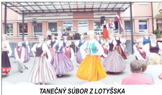
TANEČNÝ SÚBOR Z LOTYŠSKA

V ďalších prázdninových týždňoch ste sa mohli zabaviť na námestí na Country