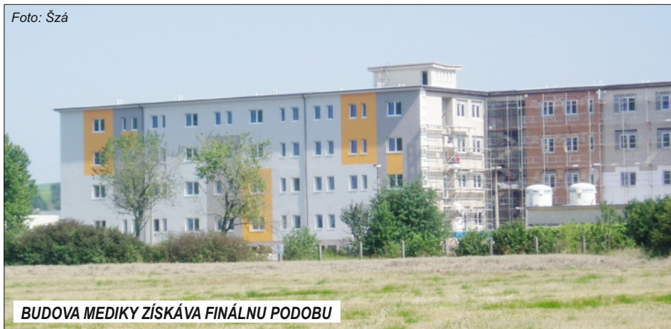
BUDOVA MEDIKY ZÍSKÁVA FINÁLNU PODOBU

Mesto Rajec podpísalo s investorom Zmluvu o budúcej zmluve, že v prípade ak investor celú budovu prerobí na nájomné byty, mesto podá žiadosť na ŠFRB o pridelenie finančných prostriedkov na kúpu nájomných bytov, a ak bude úspešné, následne byty od investora odkúpi. Vo februári tohto roka Mesto Rajec túto žiadosť podalo a v súčasnosti sa môžeme pochváliť, že Mesto Rajec bolo úspešné a finančné prostriedky na kúpu bytov získalo. Na 67 nájomných bytov sme získali nenávratnú dotáciu vo výške 40 % (zhruba 1,2 milióna eur) a návratnú pôžičku vo výške 60 % zo ŠFRB (zhruba 1,7 mil. €), ktorá je splatná 30 rokov a budúci nájomníci ju budú splácať vo svojom nájme.