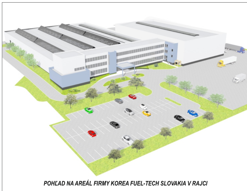
POHLAD NA AREÁL FIRMY KOREA FUEL-TECH SLOVAKIA V RAJCI

Celý proces výroby je závislý na dodávke požadovaného objemu elektrickej energie. Ihneď ako nám Stredoslovenská energetika dodá elektrinu, malo by to byť do konca septembra, môžu v októbri prísť prvé vstrekovacie lisy, ktorých bude 16 a najťažší z nich bude vážiť 95 ton. Do konca novembra by sa tieto stroje mali namontovať a spojiť – musia byť napojené technologicky, prepojené s počítačmi a serverom, musia byť pripojené roboty, ktoré podajú hotový výlisok na pracovnú plochu a operátori