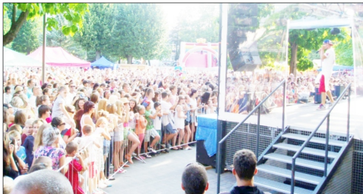
VEĽKÝ RAJECKÝ DEŇ – VYSTÚPENIE MAJKA SPIRITA

vo psíky, ktoré prišli súťažiť o titul Rajecký krásavec . Celodenné podujatie bolo okrem súťaží doplnené rôznymi vystúpeniami psích záchranárov. V nedeľu 7. septembra sme sa na námestí rozlúčili s letom Koncertom filmovej hudby , na ktorom svoje