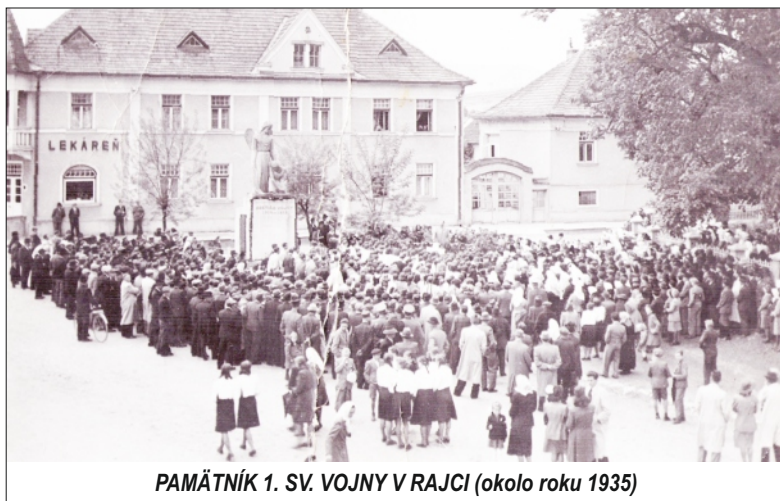
PAMÁTNÍK 1. SV. VOJNY V RAJCI (okolo roku 1935)

Spracovala: Šzá 1x foto: depozit Mestského múzea v Rajci