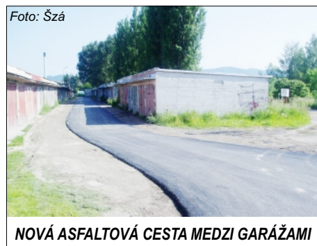
NOVÁ ASFALTOVÁ CESTA MEDZI GARÁŽAMI

Vzhľadom na to, že boli neustále problémy s údržbou cesty medzi garážami na Športovej ulici, rozhodli sme sa, že v minimálnej šírke tam položíme asfaltový koberec. Cesta bola plná výtlkov, výmlov a po každom daždi bola cesta neprejazdná a sťažnosť od obyvateľov stále pribúdalo. Dnes (5.6.2014) je tu už nová cesta, ktorá vydrží minimálne 10 rokov.