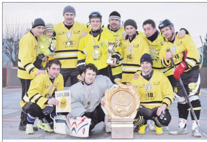
VÍTAZ TURNAJA MUŽSTVO RETRO

Na turnaj si našlo cestu aj množstvo divákov, ktorým bol na občerstvenie k dispozícii čaj a vianočný punč, takisto si mohli