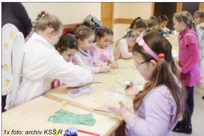
1x foto: archív KSS Rajec

Spoločne sme tvorili priam umelecké diela. Deti si vlastnoručne vyskúšali vyvaľkať cesto, vykrajovali medovníčky a po upečení si ich aj krásne vyzdobili. Taktiež vyrábali vianočné ozdoby – anjelika a vianočný stromček vyzdobený snehovými vločkami. Všetkých zachvátilo tvorivé nadšenie a radosť.