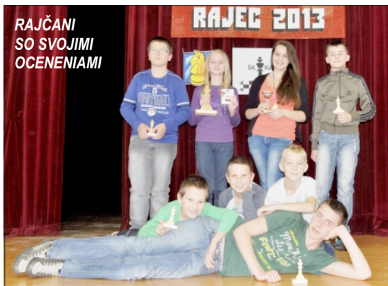
RAJČANI SO SVOJIMI OCENENIAMÍ