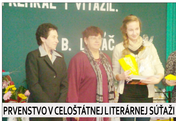
PRVENSTVO V CELOŠTÁTNEJ LITERÁRNEJ SÚŤAŽI