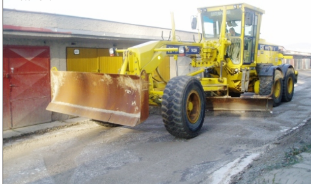
ÚPRAVA CESTY MEDZI GARÁŽAMI NA ŠPORTOVEJ ULICI

Cestu sme vyrovnali špeciálnym strojom (grédrom) a zavalcovali sme ju. Táto úprava by mala nejaký čas vydržať. Ak by v budúcnosti malo Mesto Rajec dostatok finančných prostriedkov, budeme uvažovať nad spevnením cesty či už cementovou stabilizáciou alebo nejakým postrekom.