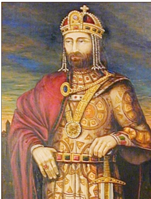
Bélu III. (1173 – 1195)

Táto časť je teda jedinou najstaršou dochovanou písomnou zmienkou o Rajci. Možno by sme mohli očakávať niečo dôležitejšie z historických prameňov, avšak viac než len takáto zmienka súvisiaca s našim mestom v tomto období nebola zistená. V úvode bolo spomenuté, že táto listina pochádza údajne z roku 1193. Podľa historikov, pri skúmaní listiny uviedli, že ide o sfaľovaný dokument, nevylučujú však, že kráľ Belo III. vydal takúto listinu. V pôvodnej listine (ak jestvovala) celkom iste nemohli byť metácie (ohraničenia majetkov) v takomto podrobnom opise, ako sú v citovanej listine. Preto dávame znenie metácie do hranatých zátvoriek.