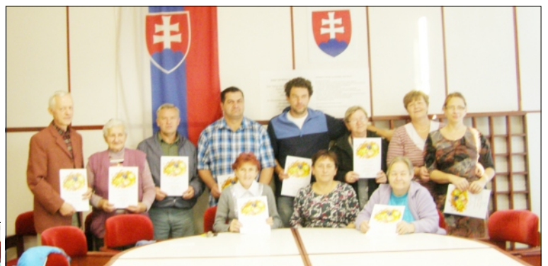
VÍŤAZNÍ PESTOVATELIA A ICH EXPONÁTY

Žijeme v zložitej, uponáhľanej dobe. Niektorí vníma všedné problémy viac, niektorí menej, čo sa odráža často na fyzickom a duševnom zdraví. S určitosťou sa dá ale povedať, že ľudia spojení s prírodou sú vyrovnanejší, priateľskejší, veselší. Tak je to aj so záhradkármi. Keď sa začnú rozprávať so svojimi rastlinkami, obyčajne z nich vyprchá negatívna energia nahromadená zo stresu moderného spôsobu života. Možno prídu domov zo svojej záhradky fyzicky unavení, ale s čistou hlavou, regenerovanou jasnou myslou. Oproti niektorým iným