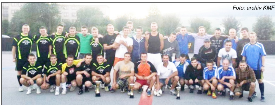
MUŽSTVÁ PRI ODOVZDÁVANÍ CIEN: zľava BARSA, TAUBENBAR JASENOVÉ, DEPORTIVO A GUNNERS