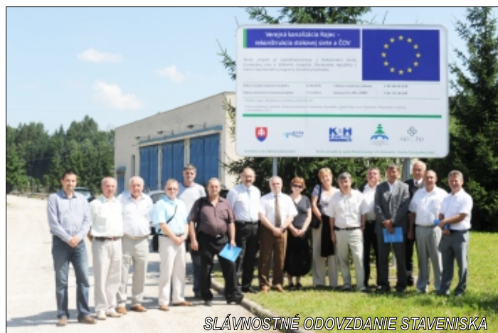
SLÁVNOSTNÉ ODOVZDANIE STAVENISKA