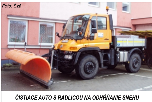
ČISTIACE AUTO S RADLICOU NA ODHRŇANIE SNEHU

Na základe rozhodnutia mestského zastupiteľstva sme objednali na auto značky Mercedes doplnkové zariadenia – pluh na odhrňanie snehu na prednú časť a posypač na zadnú časť. Keďže nadstavby sme museli obstarat verejným obstarávaním – čo je zdĺhavý proces, obe nadstavby by nám mali dodať až na prelome januára a februára. Avšak na základe ústretovosti firmy, ktorá nám zariadenie má dodať, nám firma