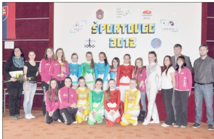
NAJLEPŠÍ ŠPORTOVÝ KOLEKTÍV – MAŽORETKY KORDOVÁNKY

ka veľkých skupín. Ako jediná Slovenka sa na Majstrovstvách Európy prebojovala do top šiestky a získala krásne štvrté miesto. Miniformácia, v ktorej tancovala, získala titul Majster Európy a ako členka skupiny je držiteľkou titulu 1. Vicemajster Európy za rok 2012.