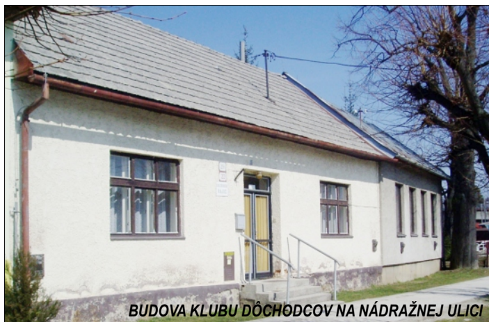
BUDOVA KLUBU DÔCHODCOV NA NÁDRAŽNEJ ULICI