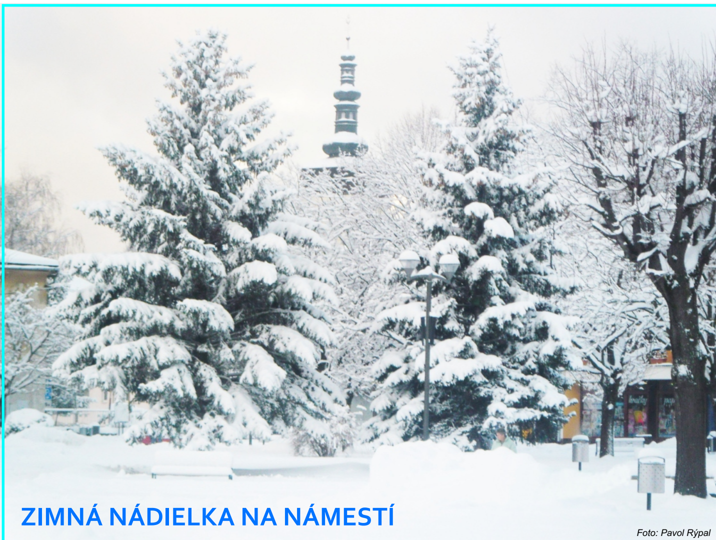
ZIMNÁ NÁDIELKA NA NÁMESTÍ