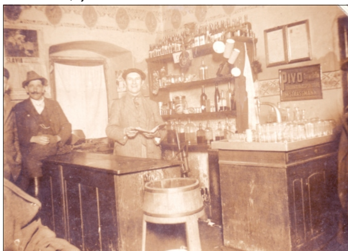
INTERIÉR NIEKDAJŠEJ MESTSKEJ KRČMY, DNES MESTSKÉHO MÚZEA

prijaté celou obcou, z čoho vyplýva, že mesto Rajec malo starodávne právo variť pivo, pričom počiatky tejto výroby nie sú známe. Varenie piva mešťanmi sa riadilo istými pravidlami, ktoré však nie sú známe. Záznam v spomenutých knihách upravuje práva členov cechu rajeckých pivovarníkov. Z neho možno vyčítať snahu zamedziť roľníkom, ktorí mali menšiu výmeru pôdy ako štvrt' prúta (prút – stará plošná miera = asi 5 jutár), akékoľvek varenie piva, ktoré zrejme bolo výnosné. Každý člen cechu pivovarníkov musel mať aspoň štvrt' prúta polí, čiže asi 1,5 jutra.