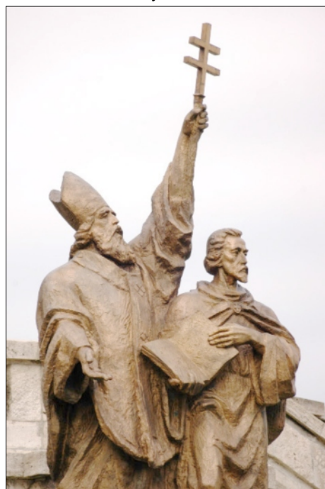
SÚSOŠIE SV. CYRILA A METODA PRI FARKOM KOSTOLE V ŽILINE

Štátne náboženstvo byzantskej spoločnosti – kresťanstvo sa stalo základom, ktorý na seba viazal mnohé zložky kultúry, či už išlo o písomníctvo, výtvarné umenie, ale hlavne o systém vzdelanosti. Veľmi skoro vzniklo a dobudovalo sa školstvo, medzi nimi aj štátna univerzita v Konštantínopole, ktoré sa ako sídlo cára začalo nazývať Carhrad.