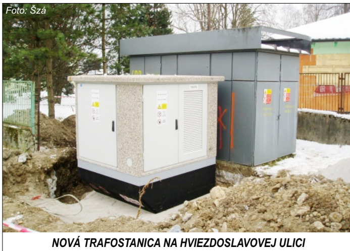
NOVÁ TRAFOSTANICA NA HVIEZDOSLAVOVEJ ULICI