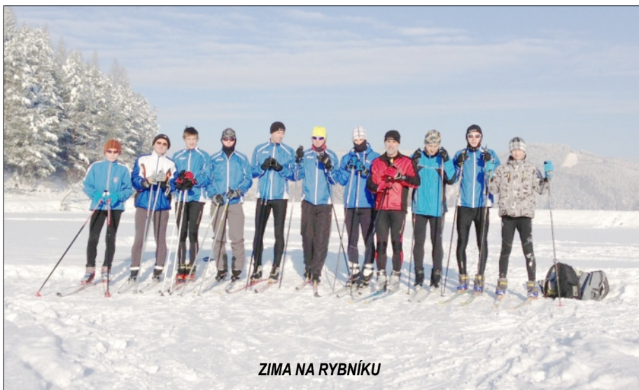
ZIMA NA RYBNÍKU