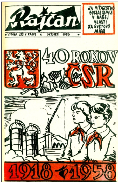
NAJSTARŠIE DOCHOVANÉ ČÍSLO ČASOPISU RAJČAN Z OKTÓBRA 1958

Aj keď sa to možno nezdá, ale aj náš/váš mesačník má za sebou niekoľko desaťročí svojej existencie. Vychádza už neuvěřiteľných 55 rokov, čo je veľmi dlhá a vzácna doba vo vydávaní časopisu.