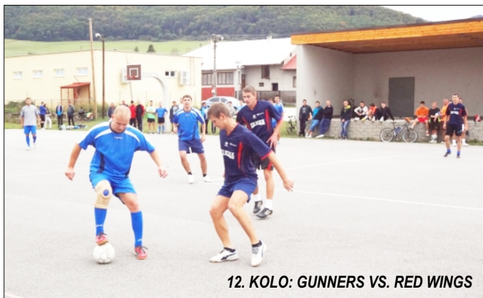
12. KOLO: GUNNERS VS. RED WINGS

No v tomto roku to bolo iné. Majster nebol taký suverénny, jednotlivé zápasy nemali jasných favoritov a o konečnom poradí sa rozhodlo až v poslednom kole. Sľubný začiatok malo Red Wings a aj Gunners, ale dlho im to nevydržalo. Opakom boli Reziváci, na body chudobný úvod ich však stál medailové umiestnenie. A tak sa od šiesteho kola na čele tabuľky striedala výlučne dvojica Tauben Bar a Barsa, ktorú ohrozovalo len Deportivo, no všetko nasvedčovalo tomu, že spoznáme po dlhých rokoch nového šampióna. Záver bol však dramatický a zamotaný. Jasenové po prehre v predposlednom kole s Barsou stratilo akúkoľvek šancu na historický titul, no zároveň ožili nádeje Deportiva. O všetkom sa teda rozhodovalo v záverečnom kole, ktoré sa, pre osádzanie mantinelov na ihrisku v Rajci, odohralo na „letisku“ v Jasenovom. Najskôr domáci Tauben Bar si víťazstvom zabezpečil druhé miesto a v poslednom zápase sa stretli v priamom súboji o majstra Barsa s Deportivom. Barsa, bez dvoch najväčších opôr napokon nestačila na skúsenejšieho súpera a klesla na 3. miesto ...a Deportivo mohlo oslavovať svoj 13. titul v rade.