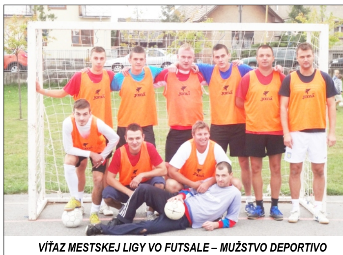
VÍTAZ MESTSKEJ LIGY VO FUTSALE – MUŽSTVO DEPORTIVO

hráčov. Podrobnejšie štatistiky si nájdete na našej webstránke www.kmfrajec.webnode.sk .