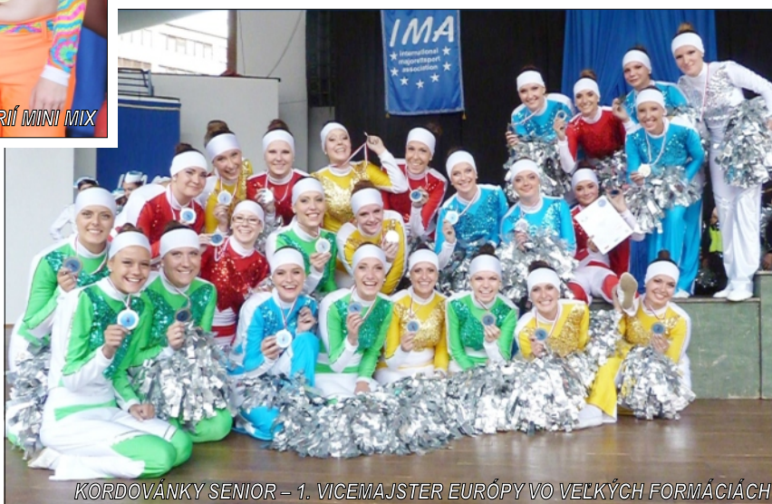
KORDOVÁNKY SENIOR – 1. VICEMAJSTER EURÓPY VO VEĽKÝCH FORMÁCIÁCH

BR – Kordovánky 4x foto: archív Kordovánok