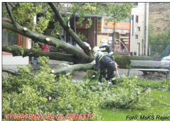
VYVRÁTENÁ LIPA NA NÁMESTÍ

sprevádzajúceho jednu z júlových búrok vyvrátená.