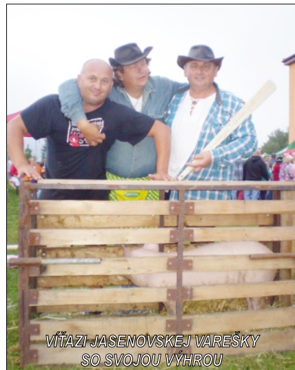
VÍTAZI JASENOVSKÉJ VAREŠKY SO SVOJOU VÝHROU