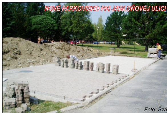
NOVÉ PARKOVISKO PRI JABLOŇOVEJ ULICI

Chcel by som spomenúť, že poslanci MZ v júni rozhodli o poskytnutí tejto dlažby aj pre potreby Základnej školy