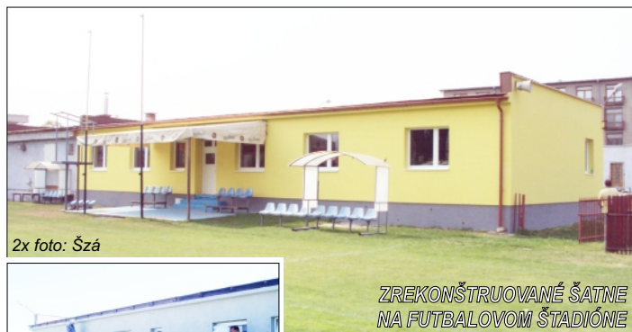
2x foto: Šzá