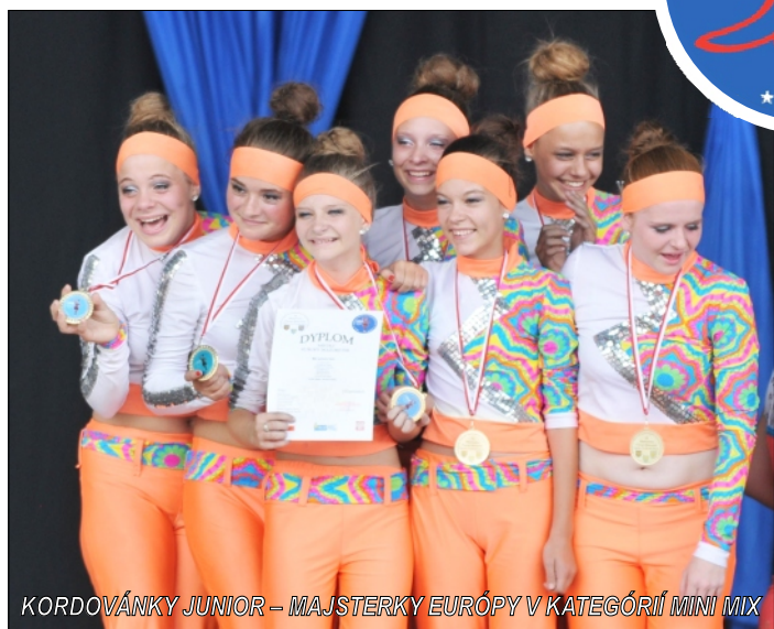
KORDOVÁNKY JUNIOR – MAJSTERKY EURÓPY V KATEGÓRIÍ MINI MIX

ťažké? Kto vie, o čom je šport, pochopí. Kto bol aspoň raz na ich tréningu, kto ich aspoň raz videl tancovať, pochopí, čo sa za tým skrýva. A to všetko pre pár minút na pódiu. Častokrát sa nepodarí všetko podľa predstáv a sen o umiestnení sa môže rozplynúť.