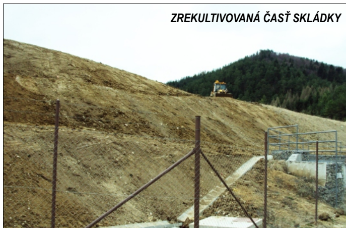
ZREKULTIVOVANÁ ČASŤ SKLÁDKY

Združenie Skládka odpadov Rajeckého regiónu pristúpilo k rekultivácii časti skládky, ktorá susedí s cestou do Hájov a bola ľudom najviac na očiach. Dnes sa vozí odpad už iba do dvoch nových kaziet. Časť, ktorá sa rekultivuje, je dokončená, dôjde tu už iba k zazeleneniu kopca – zaseje sa tráva a vysadia sa kríky, aby sa umelý kopec, ktorý tam vznikol, začlenil do okolitej prírody.