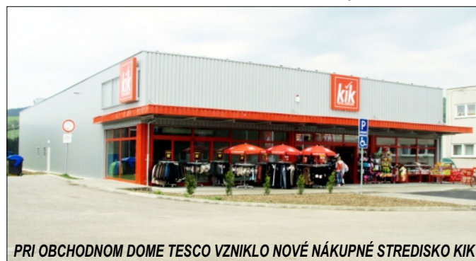
PRI OBCHODNOM DOME TESCO VZNIKLO NOVÉ NÁKUPNÉ STREDISKO KIK