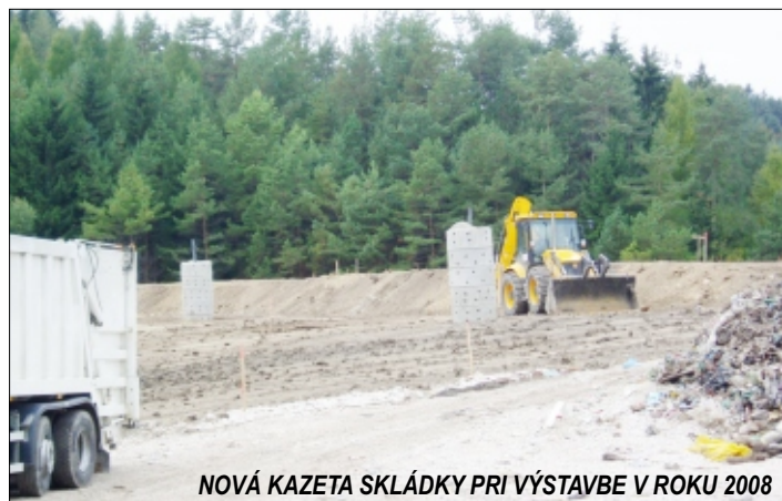
NOVÁ KAZETA SKLÁDKY PRI VÝSTAVBE V ROKU 2008

Porovnaním množstva odpadu uloženého na skládke odpadov z mesta Rajec v roku 2011 s rokom 2010 bolo zaznamenané zvýšenie množstva komunálneho odpadu. Najväčší nárast bol zaznamenaný v objemovom odpade a v stavebnom odpade, ktorý pochádzal najmä z nelegálne uloženého odpadu.