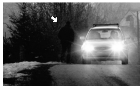
TAKTO VIDÍ VODIČ AUTOMOBILU NEOSVETLENÉHO CHODCA – TAKMER HO VÔBEC NIE JE VIDIEŤ

... A NA POROVNANIE TRI RÔZNE DRUHY ODEVU CHODCOV