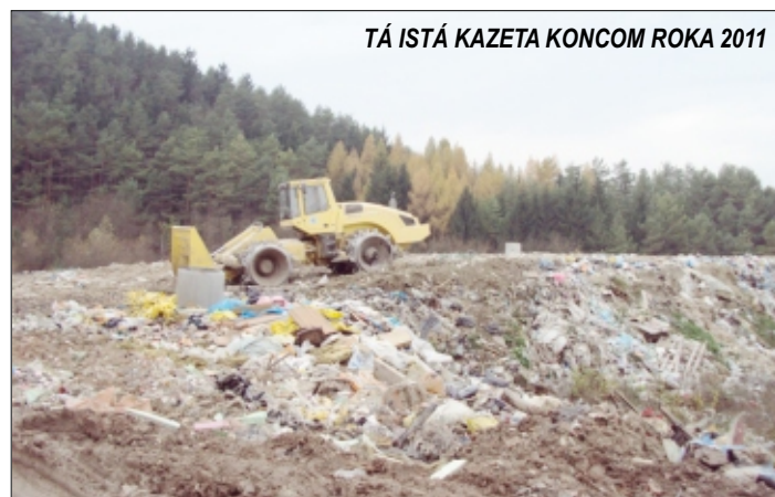
TÁ ISTÁ KAZETA KONCOM ROKA 2011

Počet občanov v meste Rajec od roku 2006 neustále klesá. Naopak množstvo celkového odpadu uloženého na skládku odpadov každoročne narastá. Kapacita skládky sa tým výrazne znižuje. V ro-