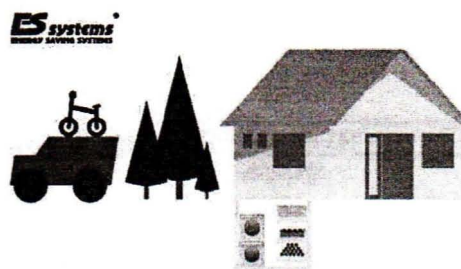
Vykurovanie panelmi ES systems®

ES systems® je záruka správnej funkcie Vašeho vykurovania