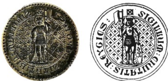
Obrázok 1. - 2.

Nedatovaná pečať priemer 52 mm, zistená v roku 1798. V obraze je sv. Ladislav s atribútmi, za ním mriežkované pozadie s ľaliami. Na zistenom odtlačku je zle čitateľný majuskulový kolopis: SIGILLUM : CIVITATIS : REYGICS. Je to mladšia napodobenina staršej pečate. (obr. 1. - 2.)