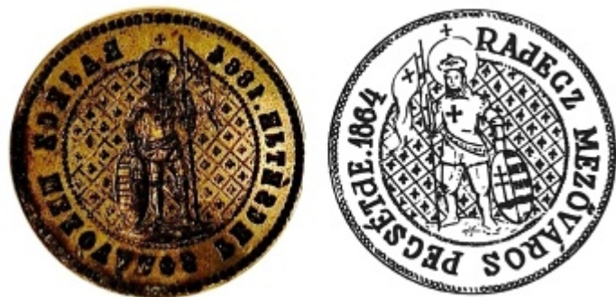
Obrázok 3. - 4.

Pečať datovaná rokom 1864. Už známy obraz sv. Ladislava a kolopis: RAJECZ MEZŐVÁROS PECSÉTIJE.1864 (obr. 3. - 4.)