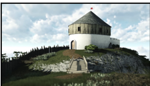
Video 3D model historickej podoby Rajeckého hradu

Cieszymy się, że dzięki udanej realizacji działań w ramach mikroprojektu osiągnęliśmy główny cel projektu: "Zachowanie naszej historii, dziedzictwa kulturowego oraz ochrony i rozwoju dziedzictwa naturalnego" .