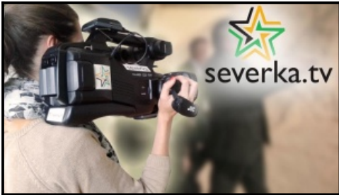
Video TV SEVERKA Okolím Rajeckého hradu