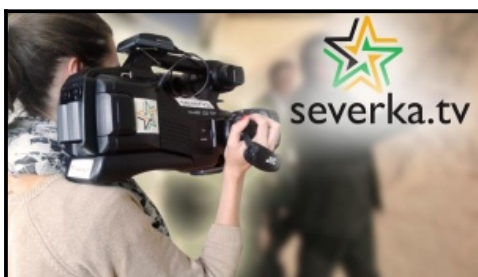
Video TV SEVERKA Okolím Rajeckého hradu