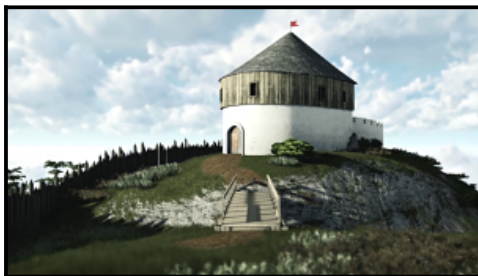
Video 3D model historickej podoby Rajeckého hradu

Cieszymy się, że dzięki udanej realizacji działań w ramach mikroprojektu osiągnęliśmy główny cel projektu: "Zachowanie naszej historii, dziedzictwa kulturowego oraz ochrony i rozwoju dziedzictwa naturalnego" .